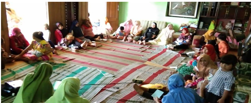
Gambar 4.2 Pemberian Materi tentang ASI Perah