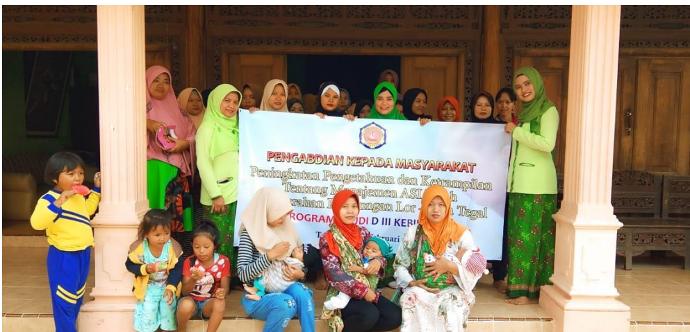
Gambar 4.5 Foto Bersama dengan Responden

ASI mempunyai banyak manfaat, namun belum banyak masyarakat yang mengetahui prosedur penyimpanan ASI perah. Masyarakat memerlukan pengetahuan tentang bagaimana