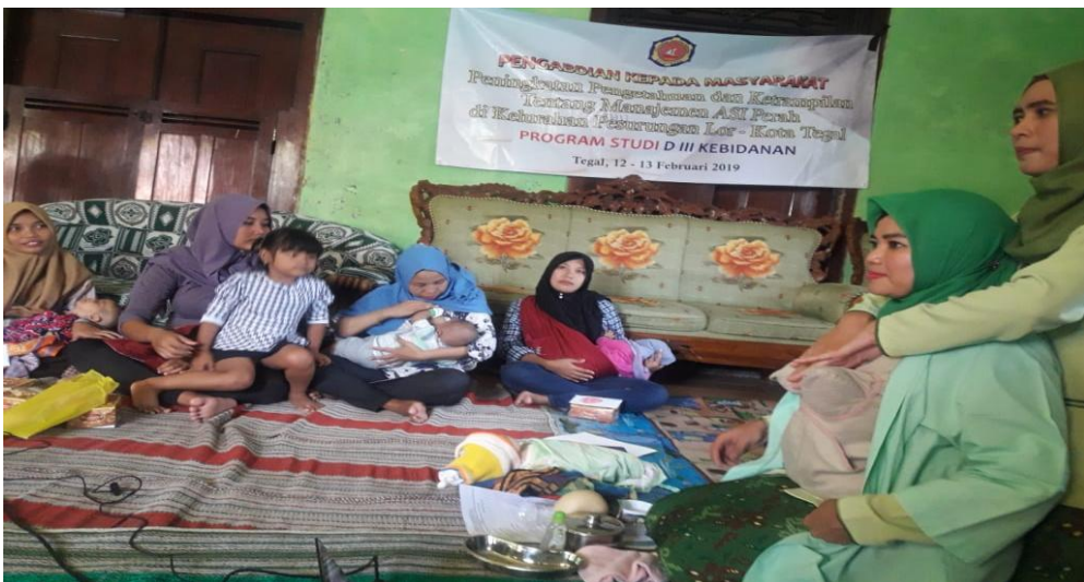
Gambar 4.4 Praktikum Perawatan Payudara