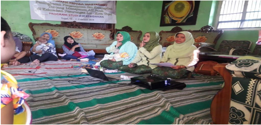
Gambar 4.3 Praktik Cara Memerah ASI dan Cara Menyusui Bayi