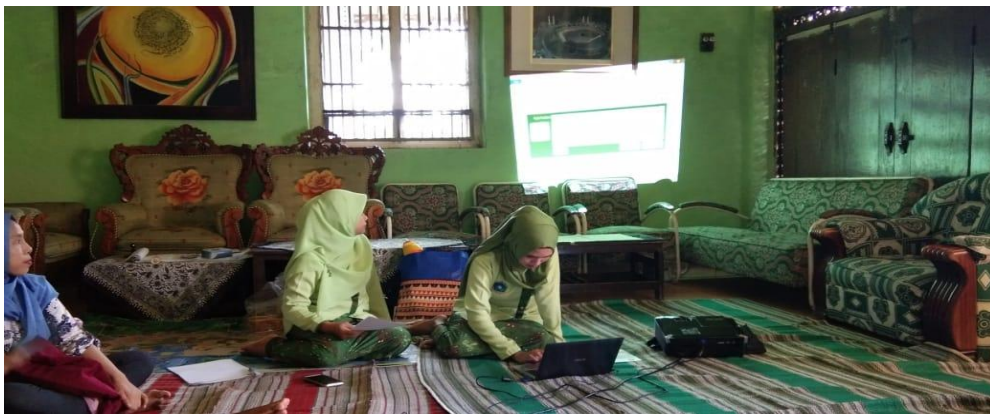
Gambar 4.1 Pemberian Materi tentang ASI Eksklusif

Pemberian materi tentang ASI Eksklusif, cara menyimpan ASI perah pada ibu menyusui dan ibu hamil trimester III. Kegiatan ini berjalan dengan lancar dan efektif selama sesi diskusi responden juga sangat antusias untuk aktif bertanya.