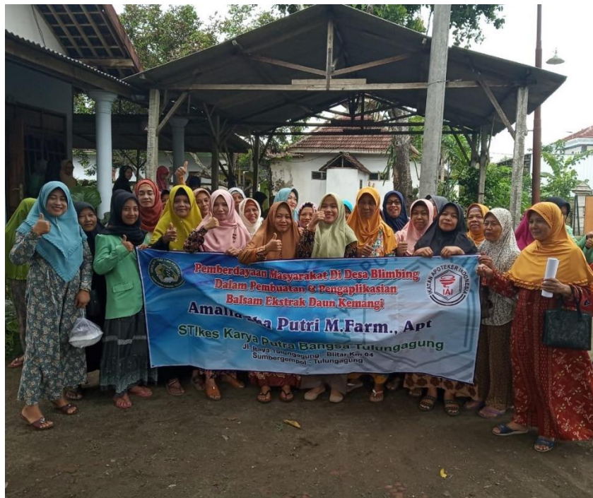
Gambar 3. Sosialisasi cara pembuatan dan pengaplikasian balsam daun kemangi

Setelah masyarakat Desa Blimbing, Rejotangan (khususnya ibu-ibu paruh baya dengan usia 40 tahun ke atas) mengetahui cara pembuatan balsam dengan menggunakan kemangi, maka pengabdian melanjutkan kegiatan pengabdian dengan memberikan sosialisasi pembuatan balsam dengan menggunakan kemangi. Kegiatan sosialisasi dilaksanakan di salah satu rumah warga Desa Blimbing, dengan pembagian leaflet dan presentasi oleh dosen pengabdian (Gambar 3).