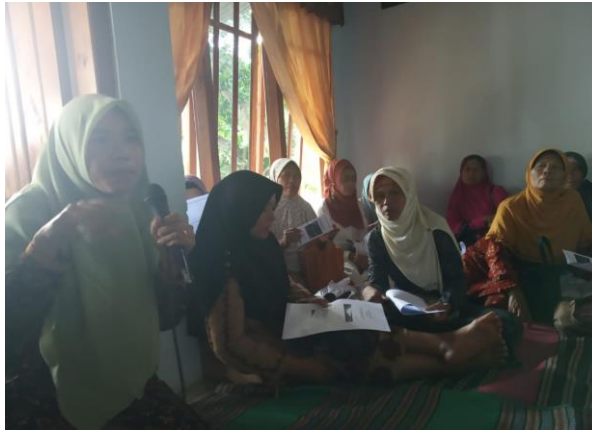
Gambar 1. Pengenalan cara pembuatan balsam dengan menggunakan kemangi