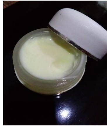
Gambar 2. Hasil pembuatan dengan menggunakan kemangi

Setelah masyarakat Desa Blimbing, Rejotangan (khususnya ibu-ibu paruh baya dengan usia 40 tahun ke atas) mengetahui cara pembuatan balsam dengan menggunakan kemangi, maka pengabdian melanjutkan kegiatan pengabdian dengan memberikan sosialisasi pembuatan balsam dengan menggunakan kemangi. Kegiatan sosialisasi dilaksanakan di salah satu rumah warga Desa Blimbing, dengan pembagian leaflet dan presentasi oleh dosen pengabdian (Gambar 3).