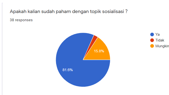
Gambar 2. Hasil kuisioner akhir

Dapat di perhatikan kalau sosialisasi dapat membantu siswa yang sebelumnya kurang paham dengan radikalisme dapat setidaknya mengerti garis besar dari radikalisme. Lalu juga terdapat beberapa feedback langsung dari para siswa, walaupun sebagian besar menjawab tidak ada feedback sama sekali, untuk mereka yang memberikan feedback mengatakan bahwa sosialisasi yang diadakan di sekolah mereka memiliki dampak yang positif untuk mereka.