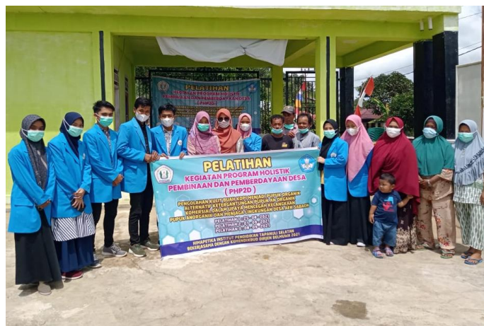
Gambar 2. Pelaksanaan Pelatihan Pengolahan Kulit Kopi menjadi Pupuk Organik

Masyarakat dusun antusias mengikuti kegiatan ini. Dari kegiatan ini, kemampuan masyarakat dalam mengolah kulit kopi menjadi pupuk organik membuat masyarakat lebih tidak tergantung pada pupuk anorganik yang notabene mahal dan sering mengalami kelangkaan. Program pengabdian masyarakat ini telah berjalan dengan lancar. Mulai dari pelatihan pembuatan pupuk organik dari kulit kopi dengan bahan-bahan : kulit kopi, air, telur, EM4 dan lain-lain. Lalu dipergakan pembuatannya kepada warga dengan memasukkan semua bahan ke dalam drum yang kemudian disimpan untuk dipermentasikan. Seminggu kemudian hasil fermentasi disaring untuk menghasilkan pupuk cair dan ampas dari penyaringan dicampur dengan kotoran hewan untuk dijadikan pupuk padat kompos. Hal ini didukung penuh oleh mitra dari