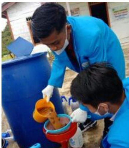
Gambar 3. Proses penyaringan Hasil Permentasi Kulit Kopi

masyarakat Desa Aek Sabaon aparat desa dan warga yang penuh antusias untuk turut serta dalam mensukseskan program ini.