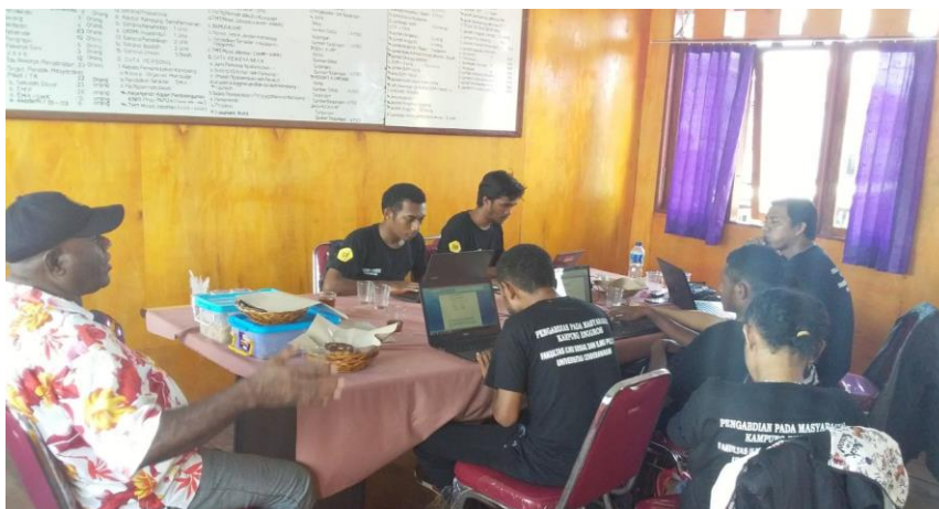
Gambar 2. Suasana Pelatihan Dasar Website kepada Pemuda dan Aparat Kampung Enggros

Kegiatan pelatihan dasar tersebut, berhasil dilaksanakan sebanyak 4 kali pertemuan, bertempat diruang kerja Kantor Kampung Enggros dimulai pukul 11.00 – 15.00 WIT tiap Hari Sabtu.