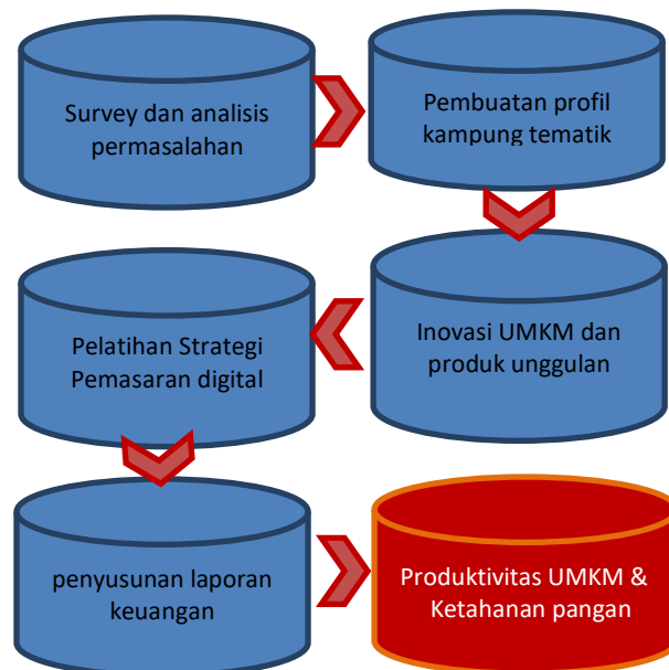
Gambar 1. Kegiatan PKM di kampung tematik Drum Bujana

Sasaran kegiatan ini adalah kelompok wanita tani dan ibu-ibu rumah tangga di kampung tematik Drum Bujana. Dimana kampung tematik Drum Bujana sendiri terdiri dari 1 RW dan 8 RT. Rata-rata 1 RW terdiri dari 60 – 80 kartu keluarga.