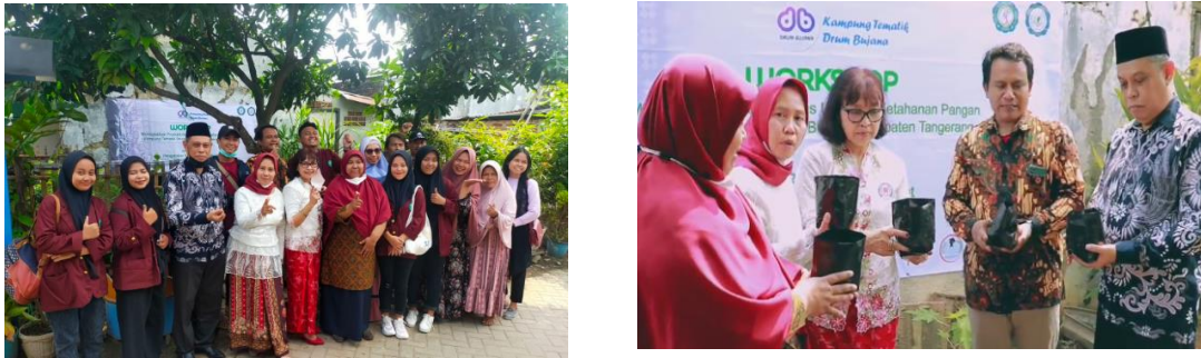
Gambar 4. Penanaman secara simbolis

Dalam peningkatan produktivitas UMKM dilakukan dengan dua kegiatan yaitu kegiatan pelatihan strategi pemasaran digital dan pelatihan penyusunan laporan keuangan secara sederhana. Peserta dari pelatihan sebanyak 41 peserta yang terdiri dari peserta perempuan sebanyak 32 orang (78%) dan peserta laki-laki berjumlah 9 orang (22%).