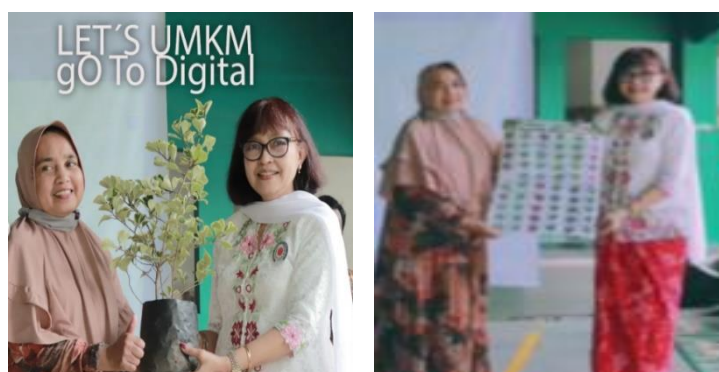
Gambar 3. Penyerahan Benih

Kegiatan berupa penyuluhan dan pendampingan dalam meningkatkan produktivitas UMKM dan ketahanan pangan. Produktivitas UMKM dilakukan melalui pelatihan strategi pemasaran secara digital dan penyusunan laporan keuangan secara sederhana yang telah dilakukan terlebih dahulu pada agenda kegiatan sebelumnya. Untuk ketahanan pangan dilakukan dengan memberikan penyuluhan dan penanaman benih dan pohon di lingkungan dan sekitar tempat tinggal warga kampung tematik Drum Bujana.