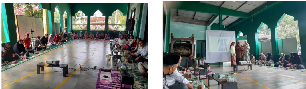
Gambar 2. Kegiatan Pelatihan dan Penyuluhan

Salah satu obyek kegiatan PKM adalah kampung tematik Drum Bujana yang berada di Perumahan Puri Permai 2, Desa Pete, Tigaraksa, Kab. Tangerang. Team yang terdiri dari 5 dosen dan 5 mahasiswa berinteraksi langsung di kampung tematik Drum Bujana. Kegiatan diawali dengan kunjungan dan pemetaan potensi dan permasalahan yang ada di kampung tematik. Dari potensi dan permasalahan yang dihadapi oleh kampung tematik Drum Bujana inilah terlihat bahwa memaksimalkan kelompok wanita tani (KWT) di kampung tematik Drum Bujana melalui penanaman obat-obatan dan sayuran yang telah dilakukan selama ini juga dimaksimalkan dengan penanaman benih dan pohon buah ( Kegiatan Pkm Di Drum Bujana - YouTube, 2022 ).