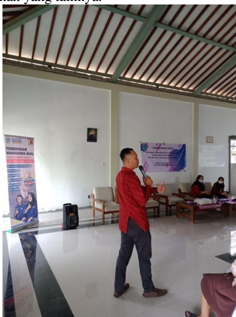
Gambar 3. Pemaparan materi ke-2

dan jangka panennya cukup cepat. Masyarakat juga dapat tanaman serih wangi secara tumpang sari dengan tanaman yang lainnya.