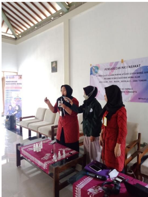
Gambar 4. Demonstrasi produk

Sesi ketiga adalah demo dalam pembuatan spray anti nyamuk dengan bahan dasar minyak atsiri serih wangi, yang dihasilkan oleh KUB Aroma Alam. Pada sesi ini, masyarakat sangat antusias karena dalam pembuatannya tergolong cukup mudah dan dengan alat yang sederhana. Cara membuat spray anti nyamuk hanya dengan mencampurkan 2 bahan dan di tambahkan dengan minyak atsiri.