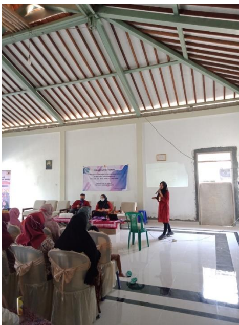
Gambar 2. Pemaparan materi ke-1

Dalam sesi pertama pengetahuan anggota KUB Aroma Alam tentang manfaat dan peluang usaha tentang sereh wangi menjadi meningkat. Anggota KUB Aroma Alam sangat antusias karena sereh wangi yang melimpah dapat dimanfaatkan menjadi berbagai macam peluang usaha.