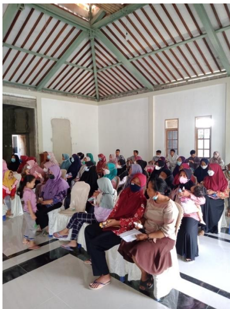
Gambar 1. Peserta pengabdian

Kegiatan dalam pengabdian kepada masyarakat di KUB aroma alam ini terdiri dari 3 sesi. Sesi yang pertama adalah penjelasan macam diversifikasi olahan minyak atsiri sereh wangi sebagai peluang bisnis. Pada sesi ini dijelaskan manfaat dari sereh wangi dan produk apa saja yang dapat dibuat menggunakan bahan dasar minyak atsiri sereh wangi. Tidak hanya menjelaskan tentang produk anggota KUB Aroma Alam juga dijelaskan estimasi dana dalam pembuatan produk dan keuntungannya.