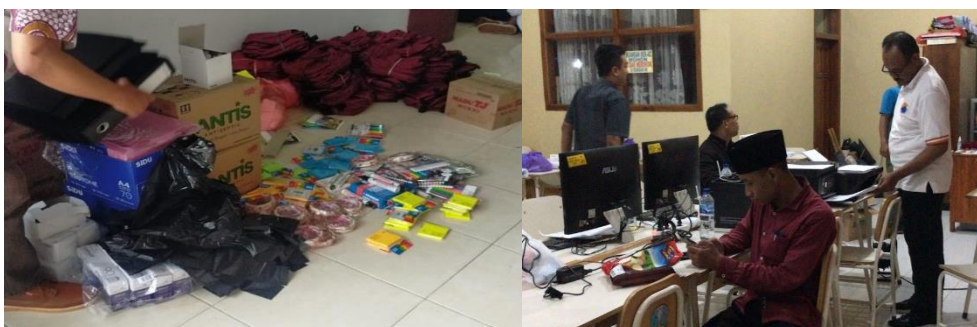
Gambar 2. Tahap Persiapan Kegiatan

Kegiatan Lokakarya Orientasi PGP Angkatan 7 Provinsi Jawa Timur dilaksanakan pada 23 Oktober 2022. Mahasiswa magang PLS Universitas Negeri Malang ditempatkan di beberapa titik di Provinsi Jawa Timur, yaitu Kabupaten Pasuruan, Kabupaten Tulungagung, Kabupaten Gresik, Kabupaten Tulungagung, Kabupaten Magetan, Kabupaten Pacitan, dan Kabupaten Sumenep. Adapun pada tahap persiapan yang telah dilaksanakan pada 21 Oktober 2022, para mahasiswa magang PLS melakukan koordinasi dengan panitia setiap wilayah terkait dengan penyesuaian jobdesk yang telah didapatkan. Adapun beberapa jobdesk yang diberikan pada mahasiswa yaitu admin operator yang memiliki tugas berkaitan dengan penginputan data diri para peserta Lokakarya Orientasi, administrasi para peserta pada Siapel serta menjadi admin keuangan yang memiliki tugas berkaitan dengan mencetak kwitansi bukti penerimaan biaya perjalanan dinas, mengelola dan bertanggung jawab atas administrasi keuangan. Selanjutnya pada tahap persiapan, para mahasiswa mempersiapkan perlengkapan kegiatan Lokakarya Orientasi meliputi ATK seluruh peserta. Serta, yang terakhir pada tahap persiapan adalah menyiapkan kelengkapan administrasi akademik dan keuangan meliputi LK peserta, dan uang.