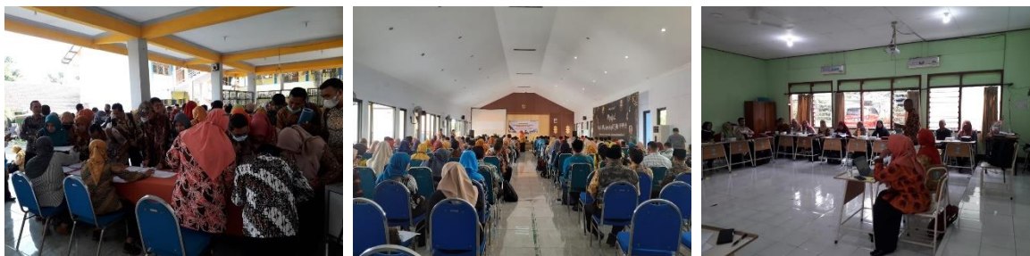
Gambar 3. Tahap Pelaksanaan Kegiatan

Tahap pelaksanaan, pada tahap ini para mahasiswa sebelumnya telah berangkat ke wilayah mitra sesuai dengan wilayah penugasannya bersama dengan Bapak/Ibu pegawai BBGP Provinsi Jawa Timur yang ditempatkan pada wilayah yang sama pada tanggal 22 Oktober 2022. Pada pelaksanaan kegiatannya pada tanggal 23 Oktober 2022, kegiatan Lokakarya Orientasi PGP Angkatan 7 dilaksanakan sejak pagi hari dimulai dengan registrasi para Calon Guru Penggerak (CGP), Kepala Sekolah (KS), Pengawas Sekolah (PS), dan Pengajar Praktik (PP), dilanjut dengan pembukaan lokakarya, games pengenalan diri, kesepakatan kelas, harapan dan kekhawatiran, perjalanan calon guru penggerak, posisi diri, dan rencana pengembangan diri. Para mahasiswa pada tahap ini melaksanakan tugas sesuai dengan jobdesk yang telah diberikan sebelumnya yaitu admin operator dan admin keuangan, sehingga kegiatan Lokakarya Orientasi dapat berjalan dengan lancar hingga akhir acara.