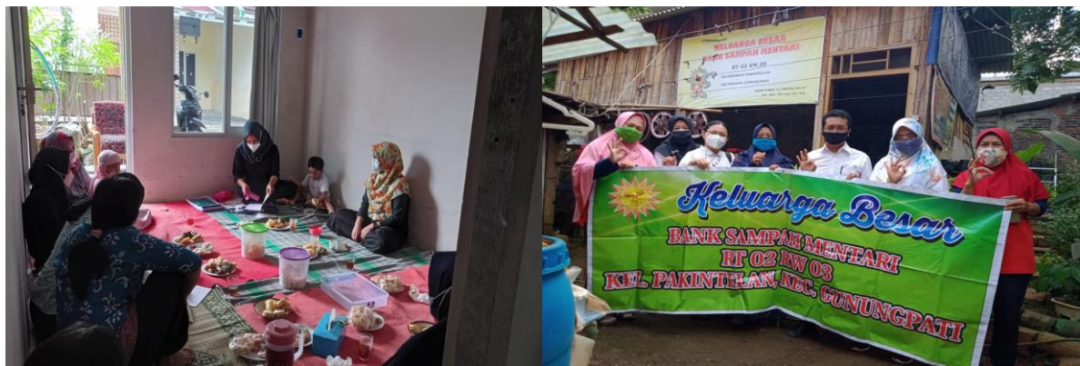
Gambar 2. Kegiatan Pengabdian di Bank Sampah Mentari

Pada tahap awal, metode ceramah diterapkan untuk mengenalkan akuntansi sederhana secara umum. Setelah itu diteruskan dengan pencatatan akuntansi, termasuk di dalamnya cara pencatatan sederhana bank sampah. Selanjutnya ceramah mengenai laporan keuangan sederhana, dimana laporan keuangan ini juga dibutuhkan bank sampah untuk mengetahui kinerja keuangannya selama ini, serta mengetahui posisi keuangan bank sampah.