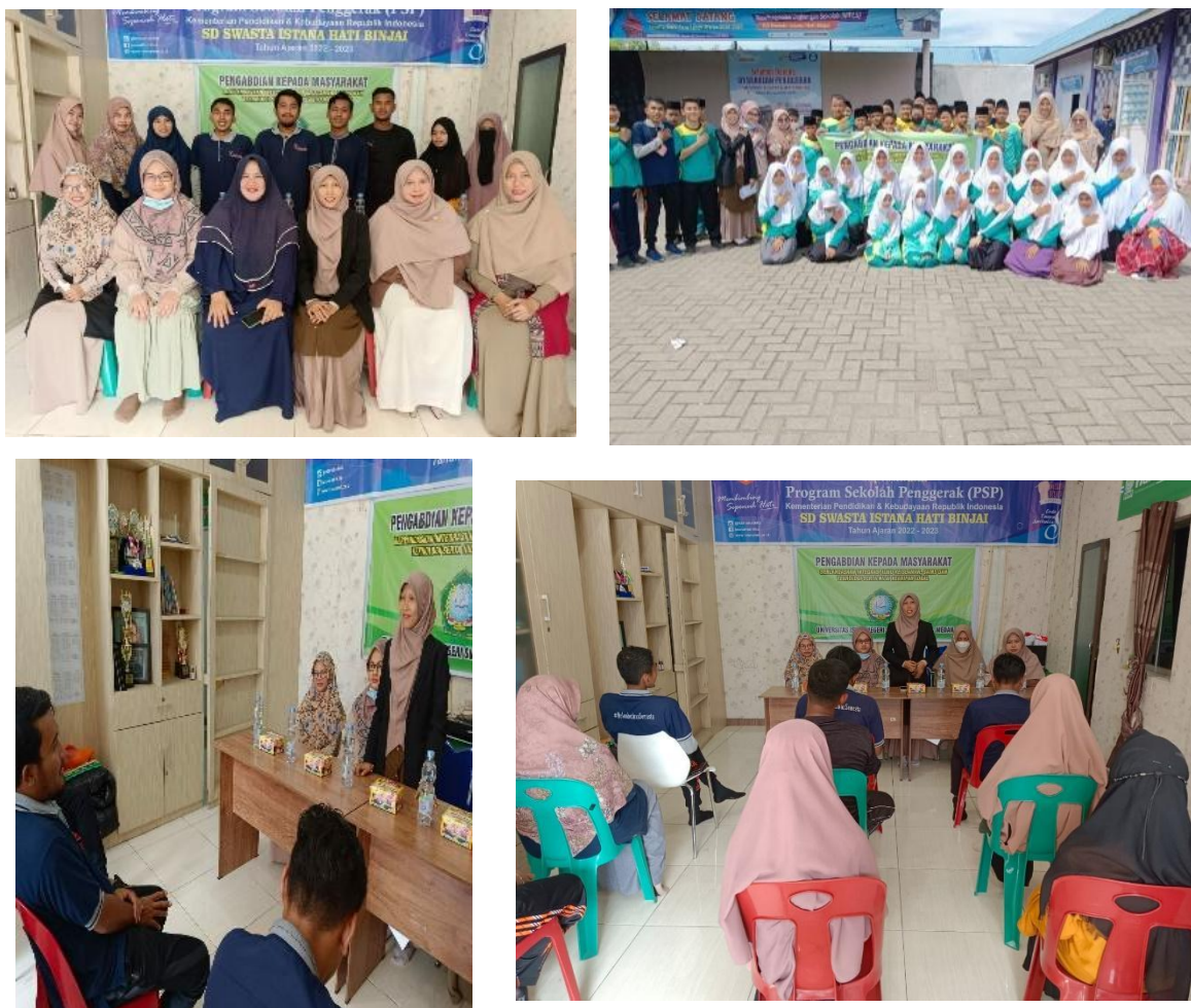
Gambar 2 Dokumentasi Pelaksanaan Tim PkM UINSU di SMP Istana Hati Binjai

Selama kegiatan pengabdian, tim PkM UINSU Medan juga mengabdikan kegiatan pelatihan dalam foto-foto yang ditampilkan pada Gambar 2.