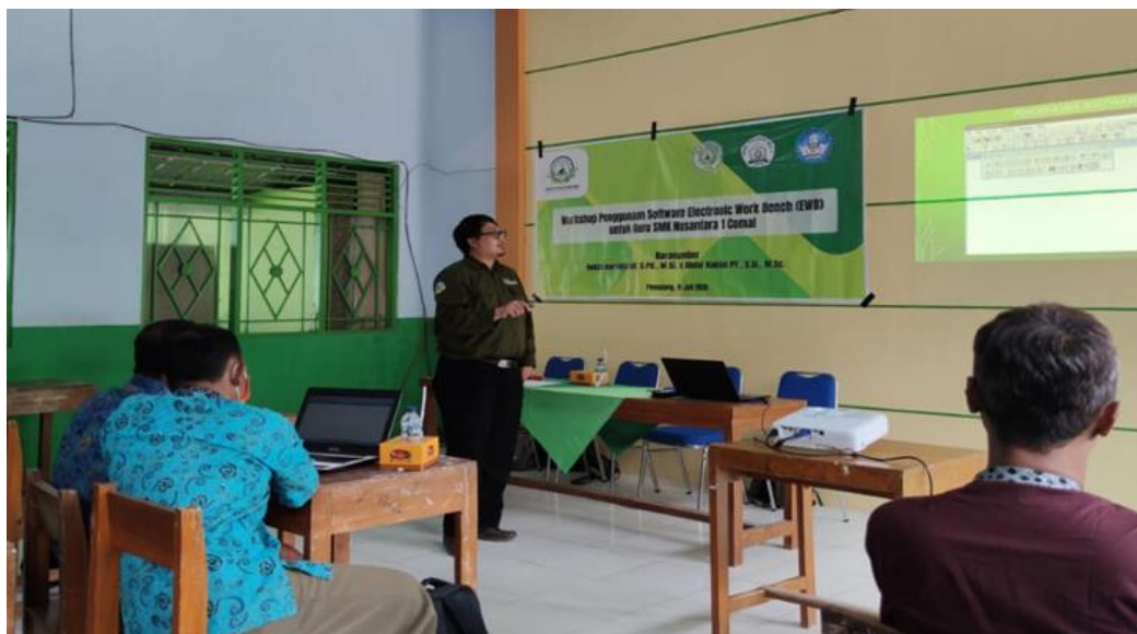
Gambar 2 Penjelasan proses instalasi software electronics workbench

Workshop penggunaan software electronic workbench dilaksanakan selama 2 jam dengan beberapa materi yang disampaikan. Materi yang pertama tentang pengenalan software electronics workbench dan alasan pentingnya penggunaan software tersebut untuk pembelajaran praktikum fisika secara online selama masa pandemi covid-19. Kemudian para peserta didampingi untuk melakukan proses instalasi software electronics workbench pada laptop masing-masing. Proses instalasi dijelaskan secara step by step agar lebih mudah dipahami oleh para peserta, penjelasan tersebut ditunjukkan pada Gambar 2.