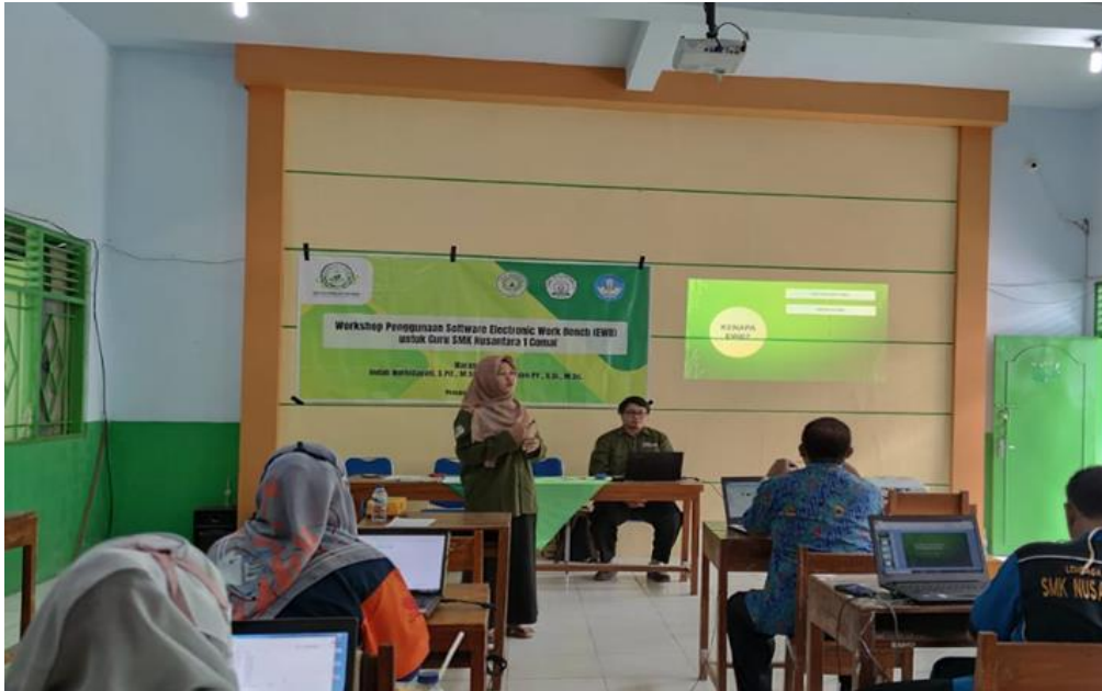
Gambar 1 Pelaksanaan Workshop

Workshop penggunaan software electronic workbench dilaksanakan selama 2 jam dengan beberapa materi yang disampaikan. Materi yang pertama tentang pengenalan software electronics workbench dan alasan pentingnya penggunaan software tersebut untuk pembelajaran praktikum fisika secara online selama masa pandemi covid-19. Kemudian para peserta didampingi untuk melakukan proses instalasi software electronics workbench pada laptop masing-masing. Proses instalasi dijelaskan secara step by step agar lebih mudah dipahami oleh para peserta, penjelasan tersebut ditunjukkan pada Gambar 2.