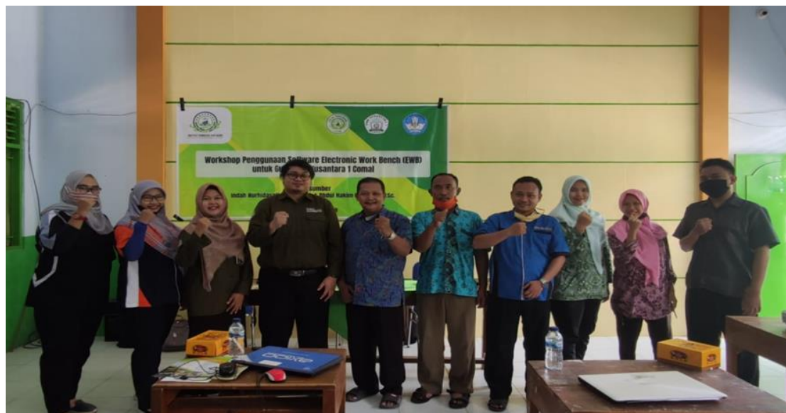
Gambar 4 Sesi foto bersama

Kemudian setelah sesi ceramah dan praktikum dilaksanakan, yang selanjutnya adalah sesi tanya jawab. Para peserta terlihat antusias dengan mengajukan beberapa pertanyaan terkait penggunaan software electronics workbench . Para peserta juga mengikuti kegiatan dari awal sampai akhir tanpa ada yang meninggalkan ruangan selama kegiatan workshop berlangsung. Lalu pada akhir sesi para peserta diberikan beberapa pertanyaan terkait materi workshop secara lisan sebagai bentuk evaluasi, dan para peserta mayoritas dapat menjawab dengan benar. Kemudian kegiatan ditutup dengan sesi foto bersama antaran Tim Pengabdian dengan para peserta seperti ditunjukkan pada Gambar 4.