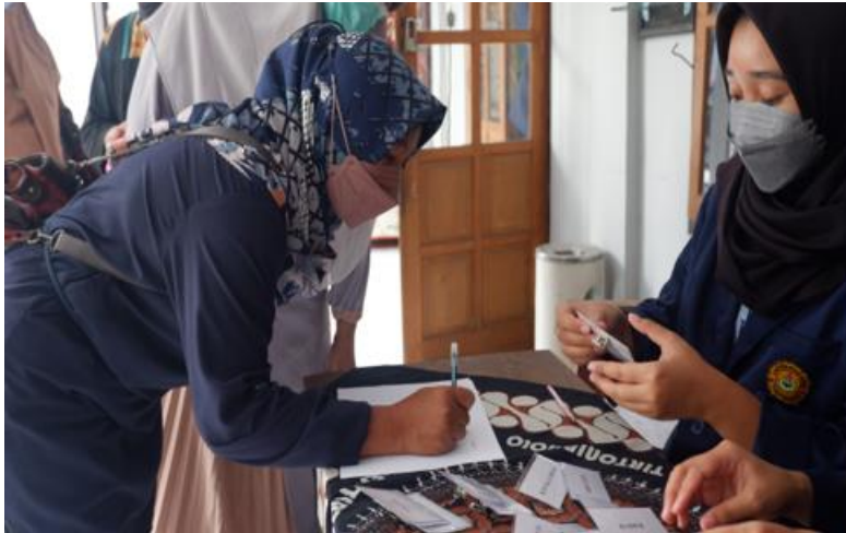
Gambar 2 Registrasi peserta

Materi yang diberikan pada pelatihan ini berisi tentang konsep pertumbuhan dan perkembangan pada balita dan metode penilaian status gizi. Selama pemaparan peserta terlihat antusias yang nampak dari beberapa peserta ada yang membagikan pengalaman selama menjadi kader khususnya bagaimana menghadapi penimbangan balita agar lebih akurat karena kondisi balita yang sudah aktif kadang sulit untuk ditimbang dan diukur tinggi badannya.