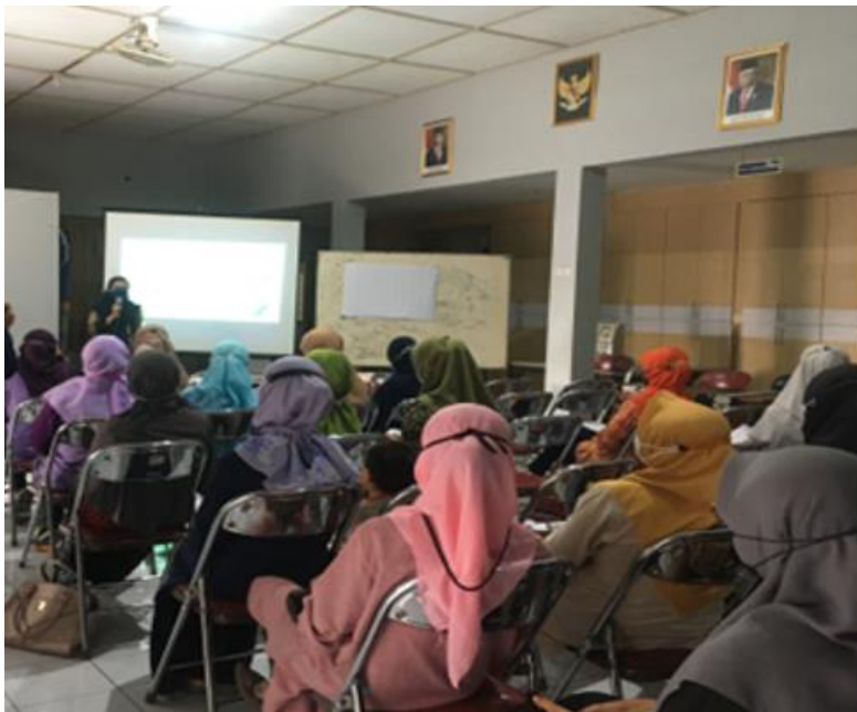
Gambar 3 Sesi pemaparan materi

Materi yang diberikan pada pelatihan ini berisi tentang konsep pertumbuhan dan perkembangan pada balita dan metode penilaian status gizi. Selama pemaparan peserta terlihat antusias yang nampak dari beberapa peserta ada yang membagikan pengalaman selama menjadi kader khususnya bagaimana menghadapi penimbangan balita agar lebih akurat karena kondisi balita yang sudah aktif kadang sulit untuk ditimbang dan diukur tinggi badannya.