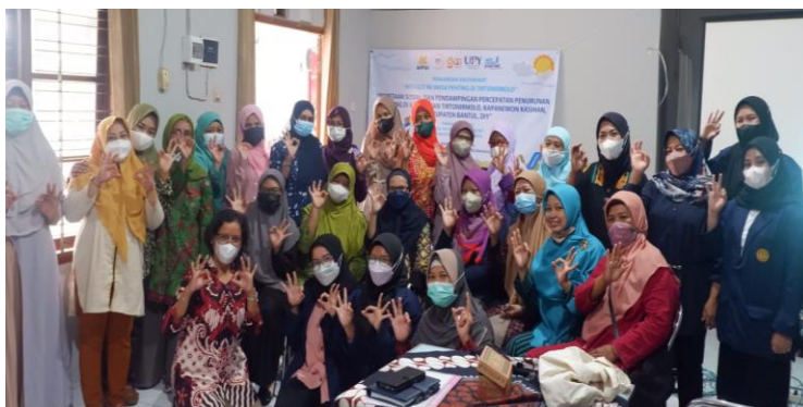
Gambar 6 Dokumentasi pengabdian beserta peserta pelatihan

melainkan juga dapat menggunakan metode lain seperti biokimia dan klinis. Sebagian peserta juga menyatakan pelatihan ini bermanfaat untuk memberikan layanan yang prima saat kegiatan posyandu pada setiap bulannya. Peserta berharap akan dilakukan pelatihan tentang gizi dan kesehatan lainnya agar informasi dan keterampilan gizi dapat terus diperbaharui mengikuti perkembangan ilmu dan teknologi.