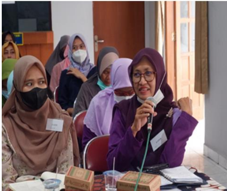
Gambar 4 Sesi studi kasus dan diskusi tanya jawab

Evaluasi pelatihan ini dilakukan dengan mengukur pengetahuan peserta melalui post-test . Post-test dikerjakan oleh seluruh peserta dengan nilai rata-rata post-test adalah 80. Hasil post-test pelatihan deteksi dini stunting menunjukkan adanya kenaikan nilai rata-rata sebesar 15 poin dari pre-test . Hal ini menunjukkan bahwa kader posyandu memiliki pengetahuan deteksi dini stunting yang bertambah. Hasil studi kasus menunjukkan bahwa sebagian besar kader mampu mendeteksi dini stunting dengan baik dan diskusi berlangsung dengan aktif.