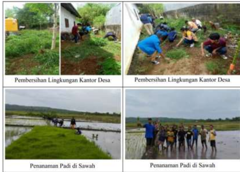
Gambar 8 Dokumentasi Kegiatan Kerja Bakti