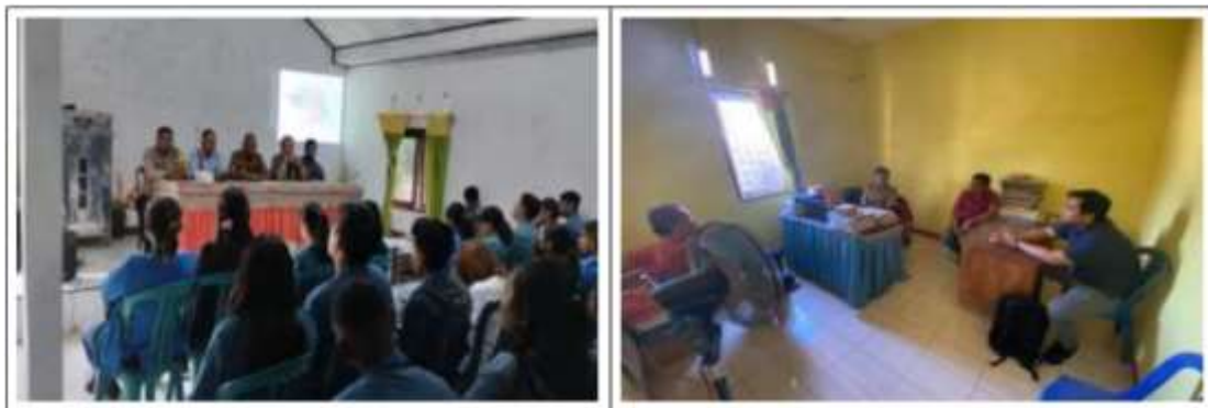
Gambar 2 Koordinasi dan Diskusi dengan pemangku wilayah Desa Penfui Timur