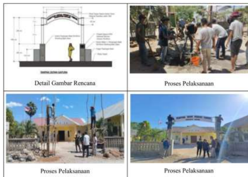
Gambar 7 Dokumentasi Kegiatan Pembangunan Gapura Kantor Desa Penfui Timur

Pembangunan gapura kantor desa penfui timur merupakan upaya perencanaan dan pelaksanaan pembangunan struktur berupa gapura yang bertujuan untuk memperindah dan memberikan identitas visual yang khas pada kantor desa. Gapura ini tidak hanya berfungsi sebagai elemen arsitektural, tetapi juga sebagai simbol kehadiran pemerintahan desa yang mewakili kesatuan dan jati diri komunitas setempat. Proses pembangunan gapura kantor desa melibatkan berbagai tahap, mulai dari perancangan desain yang mencerminkan ciri khas budaya dan nilai-nilai lokal, hingga pelaksanaan konstruksi yang memperhatikan aspek keamanan, keindahan, dan ketahanan struktur dalam jangka panjang. Dengan adanya gapura ini, diharapkan kantor desa dapat lebih dikenal secara visual oleh warga dan pengunjung serta menjadi salah satu bentuk komitmen dalam mengembangkan lingkungan desa yang representatif dan berdaya. Berikut ini merupakan dokumentasi hasil kegiatan yang telah dilaksanakan.