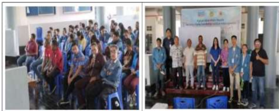
Gambar 3 Pelaksanaan Pelatihan kepada Pekerja Bangunan

Kegiatan ini sangat penting dilakukan agar masyarakat di Desa Penfui Timur, yang mayoritas mata pencahariannya adalah buruh dan tukang, dapat meningkatkan pemahaman mereka dalam Teknik Konstruksi, optimalisasi penggunaan peralatan, kesadaran akan pentingnya keselamatan, pemahaman tentang standar dalam konstruksi, serta penguatan kerja tim. Dengan pelaksanaan kegiatan ini, diharapkan masyarakat Desa Penfui Timur yang terlibat dalam pekerjaan konstruksi dapat memperoleh peningkatan pengetahuan dan keterampilan yang mendukung peningkatan kualitas pekerjaan mereka.