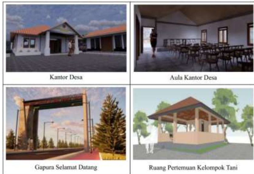
Gambar 5 Hasil Design Fasilitas Desa Penfui Timur