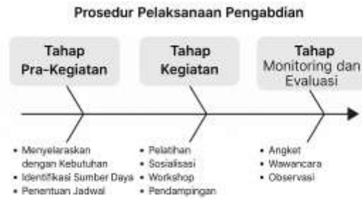
Gambar 1 Diagram prosedur pelaksanaan