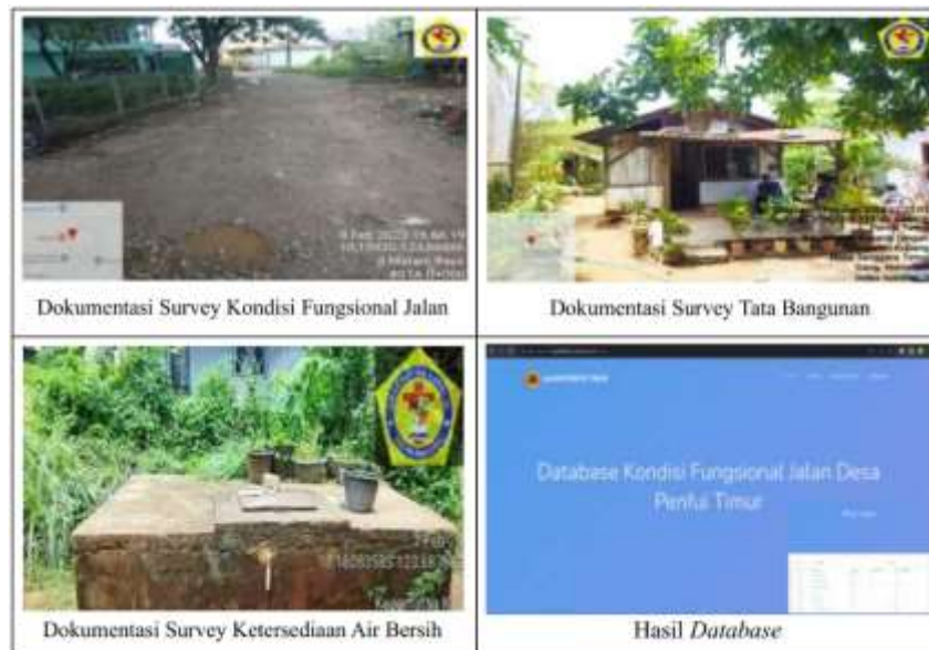
Gambar 4 Database Infrastruktur Desa Penfui Timur

Survey database adalah proses pengumpulan, pengorganisasian, dan analisis data yang dilakukan untuk mengumpulkan informasi terperinci tentang suatu kelompok data tertentu dalam basis data [8], [9]. Tujuan utama dari survey database adalah untuk mendapatkan wawasan yang lebih dalam tentang struktur, isi, dan karakteristik data yang ada dalam basis data tersebut. Survey ini mencakup evaluasi kondisi jalan, ketersediaan air bersih, dan tata bangunan. Hasil survei ini kemudian diolah dan diintegrasikan ke dalam Basis Data Infrastruktur Desa yang implementasinya adalah dalam bentuk situs web : http://penfuitimur.unwira.ac.id/