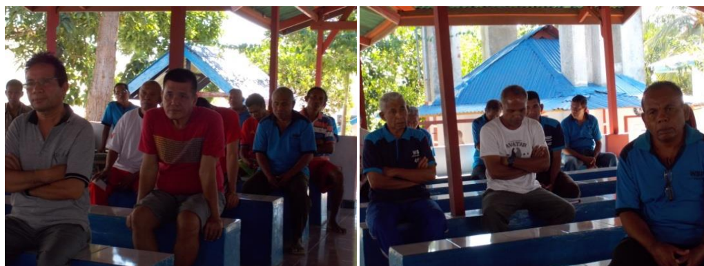
Gambar 3 Para peserta mendengarkan ceramah