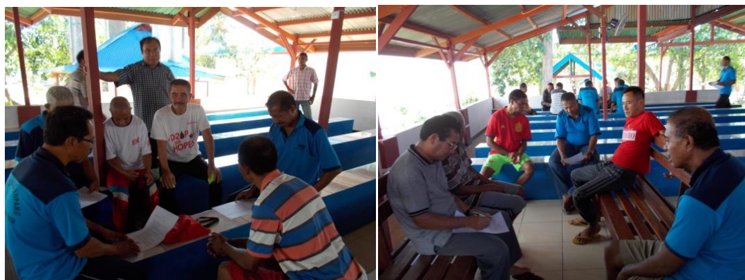
Gambar 4 Suasana sharing dalam kelompok

hidup mengatakan bahwa di Lapas, satu-satunya hiburan batin baginya adalah berdoa kepada Tuhan dan aktif dalam kegiatan rohani seperti ikut kelompok doa Legio Maria. Selain itu dia terlibat pula secara aktif dalam persiapan ibadat seperti latihan koor untuk misa hari minggu.