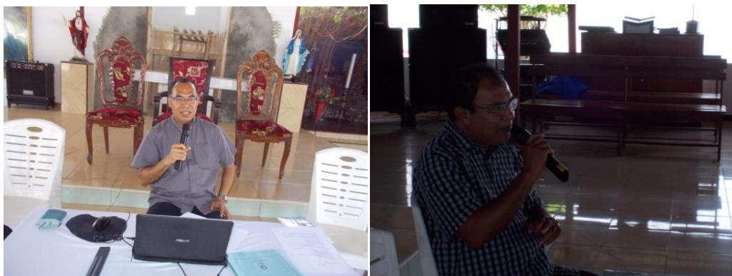
Gambar 2 Para penceramah membawakan materi