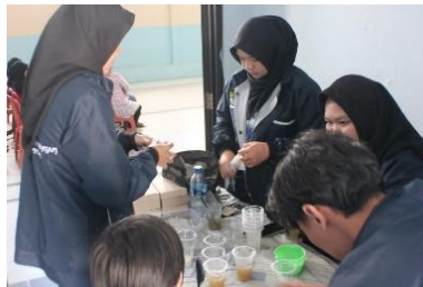
Gambar 3 Pembagian Serbuk Minuman Jahe Merah

Jahe biasanya digunakan sebagai minuman kesehatan, karena kandungan shogaol dan gingerol yang ada pada jahe berfungsi sebagai antiemetic [13]. Studi menunjukkan bahwa 6-shogaol, 6-gingerol, dan zingerone memiliki kemampuan untuk menghambat respons reseptor 5-HT 3 yang dapat mengatasi mual muntah. Jahe juga dapat mengurangi nyeri pinggang. Hal ini karena jahe berfungsi sebagai analgetika, sedatif, antipiretik, dan antipiretik [14].