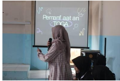
Gambar 2 Penyampaian Pemanfaatan TOGA

Jahe biasanya digunakan sebagai minuman kesehatan, karena kandungan shogaol dan gingerol yang ada pada jahe berfungsi sebagai antiemetic [13]. Studi menunjukkan bahwa 6-shogaol, 6-gingerol, dan zingerone memiliki kemampuan untuk menghambat respons reseptor 5-HT 3 yang dapat mengatasi mual muntah. Jahe juga dapat mengurangi nyeri pinggang. Hal ini karena jahe berfungsi sebagai analgetika, sedatif, antipiretik, dan antipiretik [14].