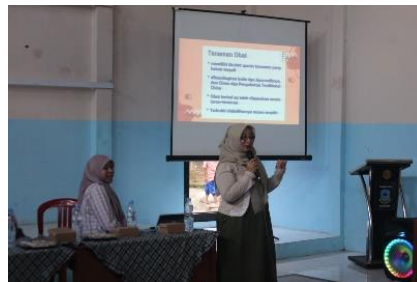
Gambar 1 Penyampaian Materi TOGA

Tujuan dari Penyuluhan Tanaman Obat Keluarga (TOGA) adalah untuk meningkatkan kesadaran, pemahaman, dan pengetahuan masyarakat tentang manfaat dan cara memanfaatkan Tanaman Obat Keluarga (TOGA) di lingkungan tertentu, seperti pekarangan rumah [12]. Selanjutnya, adalah penyuluhan tentang tanaman obat keluarga (TOGA), yang mencakup definisi, pemanfaatan, dan pembagian TOGA, serta berbagai contohnya, terutama yang berasal dari rimpang yang dapat dikonsumsi untuk kesehatan. Penyuluhan ini diawali dengan mengajukan beberapa pertanyaan yang berkaitan dengan TOGA oleh narasumber kepada peserta. Hal ini harus dilakukan sebelum penyuluhan dimulai untuk mengetahui seberapa baik pemahaman dasar peserta tentang TOGA. Setelah itu, materi TOGA dipaparkan selama satu jam.