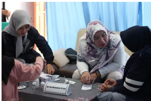
Gambar 4 Pemeriksaan kadar gula darah sewaktu, kolesterol, dan asam urat

Penyakit asam urat, juga dikenal sebagai gout, adalah kondisi sendi yang disebabkan oleh tingkat asam urat yang berlebihan dalam darah. Pada umumnya, asam urat dilepaskan dari tubuh melalui urin [9]. Aterosklerosis, kondisi yang dikenal sebagai penyempitan pembuluh darah, disebabkan oleh tumpukan kolesterol berlebih di dalam dinding pembuluh darah dan kemungkinan pembentukan plak [10].