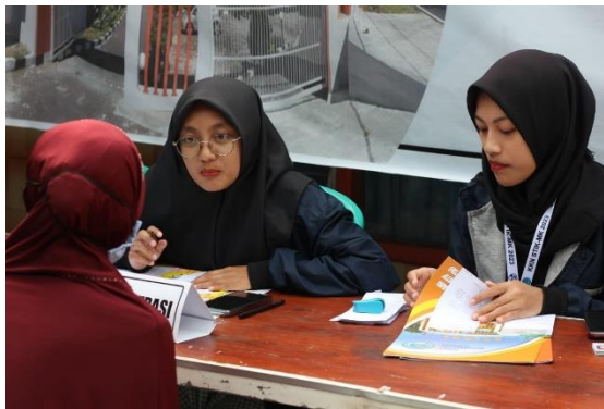
Gambar 2 Kegiatan pendaftaran

Proses kegiatan dimulai dengan pendaftaran, registrasi pasien dilakukan dengan membawa kartu identitas atau kartu jaminan kesehatan. Dilanjutkan dengan pemeriksaan kesehatan yang diawali dengan pencatatan keluhan kesehatan yang dialami oleh pasien menimbang berat badan dan tinggi badan.