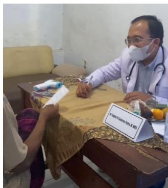
Gambar 5 Anamnesa, pemeriksaan, dan pemberian resep obat oleh dokter

Warga yang telah selesai melakukan pemeriksaan kesehatan akan diarahkan untuk melakukan pemeriksaan lanjutan oleh dokter. Dokter melakukan anamnesa dengan mengajukan pertanyaan tentang penyakit keluhan dan gangguan saat ini dan perjalanannya. Kemudian dokter akan meresepkan obat.