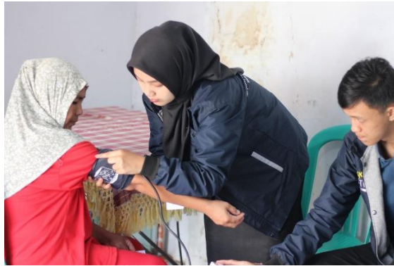
Gambar 3 Pemeriksaan tekanan darah

Pemeriksaan kesehatan sangat penting dilakukan sebagai salah satu upaya dalam deteksi dini penyakit degeneratif [8]. Pemeriksaan skrining kesehatan yang dilakukan meliputi pemeriksaan tekanan darah, gula darah dan asam urat, dan kadar kolesterol. Kegiatan ini memberikan hasil bahwa pengontrolan kadar gula darah meningkatkan pengetahuan tentang obat DM dan pengelolaan gaya hidup sehingga dapat meningkatkan kualitas hidup pasien dengan riwayat penyakit DM.