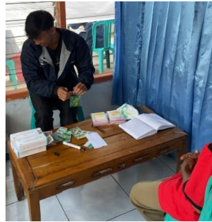
Gambar 6 Penyerahan obat dan KIE

Mahasiswa membantu menyiapkan obat yang telah dokter resepkan dan melakukan pelayanan KIE pada pasien mengenai aturan pakai obat dan fungsi obat yang didapatkan. Memberikan informasi tentang terapi non farmakologi. Untuk menilai keberhasilan proses pemeriksaan kesehatan, diakhir sesi, dilakukan evaluasi kegiatan.