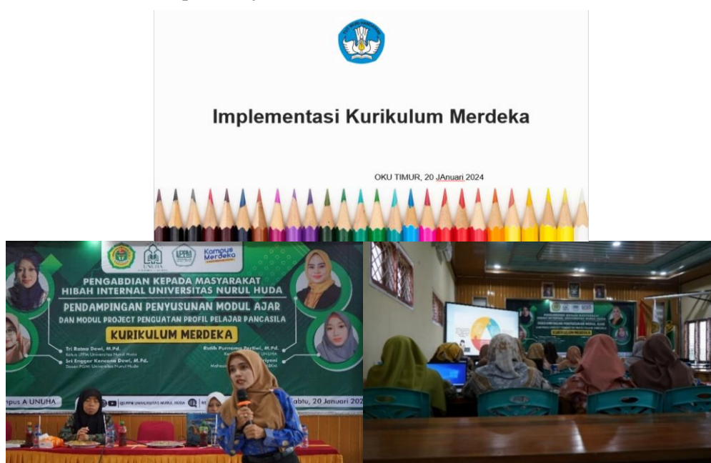
Gambar 2 Dokumentasi Pelaksanaan Seminar

Seminar IKM dilakukan pada hari Sabtu, 20 Januari 2024, dalam pelaksanaan tersebut di ikuti oleh 25 guru yang ada di MI Nurul Huda, TIM Pengabdian dalam hal ini mendatangkan pemateri yang memang memiliki kapasitas dan keahlian dalam IKM beliau adalah Ibu Lili Suharningsih, S.T. beliau seorang guru penggerak dan narasumber di berbagai kegiatan terkait Kurikulum Merdeka dan pembelajaran.