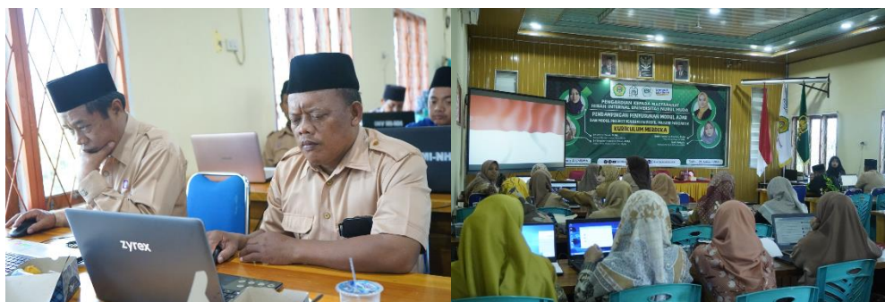
Gambar 3 Dokumentasi Pelaksanaan Pendampingan

Dari kegiatan yang dilakukan peserta/guru pendampingan dan pelatihan diharapkan dapat mengembangkan kompetensinya dalam Menyusun modul ajar. Modul ajar merupakan perangkat pembelajaran atau rancangan pembelajaran yang berlandaskan pada kurikulum yang diaplikasikan dengan tujuan untuk mencapai standar kompetensi yang telah ditetapkan, modul ajar mempunyai peran utama yang menopang guru dalam mengimplementasikan pembelajaran. Pada penyusunan perangkat pembelajaran/modul ajar yang berperan penting adalah guru. Guru diasah kemampuan berfikirnya untuk dapat kreatif, inovatif dalam penyusunan modul ajar. Oleh karena itu, membuat modul ajar merupakan kompetensi pedagogik guru yang perlu dikembangkan, hal ini agar Teknik mengajar guru di dalam kelas lebih efektif, efisien, dan tidak keluar pembahasan dari indicator pencapaian pembelajaran.