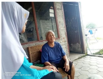
Gambar 2 Wawancara terhadap warga

Kegiatan pelatihan perawatan jenazah berhasil dilaksanakan dengan kegiatan pra acara berupa dua kali pertemuan untuk koordinasi sebelum acara pelatihan dengan pengurus takmir masjid Al Ittihad Babadan dan wawancara dengan beberapa warga (Gambar 2). Hasil koordinasi merencanakan pelatihan sebanyak empat kali karena permohonan pelaksanaan di malam hari, supaya yang hadir lebih banyak.