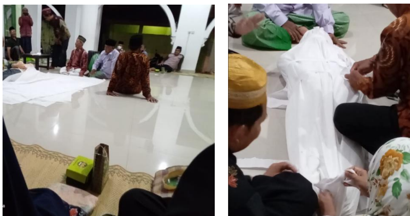
Gambar 4 Praktek mengkafani jenazah

Kegiatan memandikan dan pengkafanan dalam islam menekankan dalam kondisi tertutup dan dilakukan oleh keluarga atau orang yang dapat dipercaya. Dalam islam keburukan atau cacat yang terdapat pada jenazah tidak boleh diceritakan. Sebaliknya apabila ditemukan kebaikan sebaiknya diceritakan supaya dapat diambil hikmah dan pembelajaran untuk orang lain. ‘Āishah RA, ia berkata: Rasulullah SAW bersabda: “Janganlah kamu sekalian mencela orang mati, karena sesungguhnya mereka telah sampai kepada apa yang mereka perbuat”. Orang yang memandikan jenazah hendaknya mengetahui hal ini. Islam sangat menekankan hal ini. Bahkan Rasulullah Saw juga bersabda: “dan barangsiapa yang menutupi aib seorang muslim, maka Allah akan tutupi aibnya pada hari kiamat” (HR. al-Bukhari dan Muslim) dan “Barangsiapa memandikan mayat (jenazah), lalu merahasiakan cacat tubuhnya, maka Allah memberi ampun baginya empat puluh kali.” (HR. Hakim)[8]. Namun demikian seringkali dari pihak keluarga yang masih berduka merasa semakin terisak ketika mereka sendiri yang memandikan, sehingga sekarang ini banyak dikembangkan jasa pelayanan jenazah atau dalam suatu padukuhan membentuk tim khusus yang yang bertugas setiap kali ada warga yang meninggal[9].