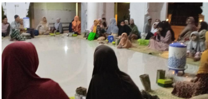
Gambar 5 Diskusi dan Tanya jawab tentang sholat jenazah

Wawancara terkait sholat jenazah terdapat warga yang menyampaikan biasanya mereka mensholatkan jenazah hanya jika itu keluarga mereka, karena keterbatasan mukena. Beberapa kali menemui keluarga jenazah tidak menyediakan mukena menjadi alasan beberapa ibu-ibu tidak mensholatkan jenazah. Dengan motivasi pahala sholat jenazah, setelah kegiatan ini semoga lebih banyak jamaah yang ikut mensholatkan jenazah. Jumlah peserta hadir pelatihan sholat jenazah sebanyak 41 orang dan penguburan jenazah dengan peserta hadir sebanyak 63 orang (Gambar 5 dan 6). Setiap selesai penjelasan disediakan waktu untuk tanya jawab apabila ada hal yang belum jelas. Selain itu juga review yaitu pemateri memberi 5 pertanyaan dan yang berhasil menjawab mendapatkan hadiah (Gambar 7). Peserta antusias hampir setiap pertanyaan ada sekitar 5 sampai 10 orang yang mengangkat tangan untuk siap menjawab pertanyaan.