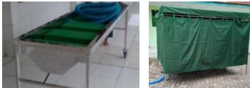
Gambar 8 Tenda dan meja pemandian jenazah

Hasil diskusi dengan takmir telah diberikan ke masyarakat meja pemandian jenazah sekaligus tenda supaya pemandian lebih sempurna dan dapat menutup aurat. Meja pemandian dan tenda pemandian sampai dengan laporan ini dibuat, telah digunakan sebanyak 2 kali.