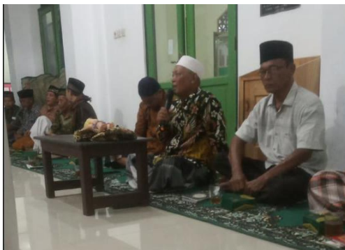
Gambar 3 Pemberian pelatihan memandikan jenazah

begitu juga terkait pengkafanan jenazah. Pada pelaksanaan pelatihan terkait pemandian jenazah jumlah peserta hadir sebanyak 61 orang dan jumlah peserta hadir pelatihan terkait pengkafanan jenazah sebanyak 63 orang (Gambar 3 dan Gambar 4). Hasil wawancara dengan warga yang biasa membantu memandikan jenazah terdapat kegiatan yang tidak dijelaskan saat materi pemandian tapi beliau lakukan adalah ngatepi , yaitu menyapu kuku keempat anggota gerak kaki dan tangan dengan batang merang yang dipotong sebanyak 28 helai masing masing kuku anggota gerak disapu dengan 7 helai.