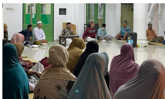
Gambar 6 Pemberian materi penguburan jenazah

Setelah dimandikan dan dikafani jenazah di dusun babadan akan di sholatkan oleh beberapa orang yang membantu mengurus jenazah dan keluarga, namun tidak semua masyarakat yang hadir dan bertakziah melakukan sholat jenazah. Semoga dengan adanya penjelasan manfaat sholat jenazah, masyarakat lebih menyadari dan menambah amalan sholat jenazah seperti yang telah dijelaskan saat pelatihan bahwa pahala sholat jenazah sangat banyak. Banyaknya orang yang mensholatkan jenazah akan membantu jenazah masuk surga selama jenazah tidak syirik kepada Allah. Dari Abu Hurairah, ia berkata bahwa Rasulullah saw bersabda “barangsiapa yang menyaksikan jenazah sampai ia menyolatkannya, maka baginya satu qiroth. Lalu barang siapa yang menyaksikan jenazah hingga dimakamkan, maka baginya dua qiroth.” Ada yang bertanya, “apa yang dimaksud satu qiroth?” Rasulullah shallallahu alaihi