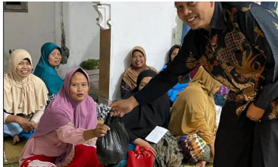
Gambar 7 Pemberian hadiah bagi yang berhasil menjawab

wa sallam lantas menjawab, “dua qiroth itu semisal dua gunung yang besar.” (HR. Bukhari dan Muslim). Tidaklah ada seorang muslim yang meninggal kemudian disholatkan oleh 3 shaf kaum muslimin kecuali wajib baginya (surga). (H.R. Abu Dawud, at-Tirmidzi, Ibnu Majah).