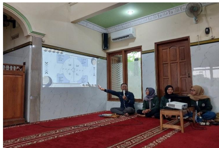
Gambar 6 Diskusi

Kegiatan penyuluhan dengan materi edukasi DAGUSIBU (Dapatkan, Gunakan Simpan, Buang) Obat dengan Baik dan Benar. Pemaparan yaitu tentang DAGUSIBU (Dapatkan, Gunakan Simpan, Buang) Obat dengan Baik dan Benar yang di dalamnya bagaimana cara mendapatkan obat dengan benar, cara menggunakannya, cara menyimpan sampai dengan cara membuang obat dengan baik dan benar. Selain itu sambil mendengarkan peserta diberikan leaflet tentang DAGUSIBU serta pemaparan menyampaikan materi serta