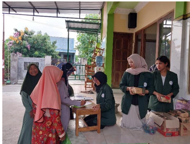
Gambar 1 Absensi Peserta

Kegiatan awal yang dilakukan adalah persiapan agar kegiatan dilaksanakan dapat berjalan dengan lancar. Dalam penyuluhan di Desa Ngiser Kecamatan Sukoharjo ini dilakukan dengan mempersiapkan seluruh keperluan kegiatan penyuluhan jauh- jauh hari. Hal-hal yang dipersiapkan diantaranya menentukan dimana acara akan digelar, perencanaan acara kegiatan, perencanaan anggaran yang diperlukan, perencanaan keperluan-keperluan kegiatan, survei tempat, perencanaan konsumsi dan kehumasan. Selain perlengkapan yang tepat juga harus mencatat semua yang diperlukan saat acara berlangsung. Materi yang disampaikan bagi masyarakat dibuat dengan sebaik mungkin agar tidak monoton [8]. Koordinasi dan bersinergi untuk kelancaran kegiatan agar dapat berlangsung dengan baik dimulai dengan membersihkan tempat acara agar tempat sudah bersih dan rapi serta mempersiapkan semua kebutuhan mulai dari sound, alat untuk memaparkan materi.