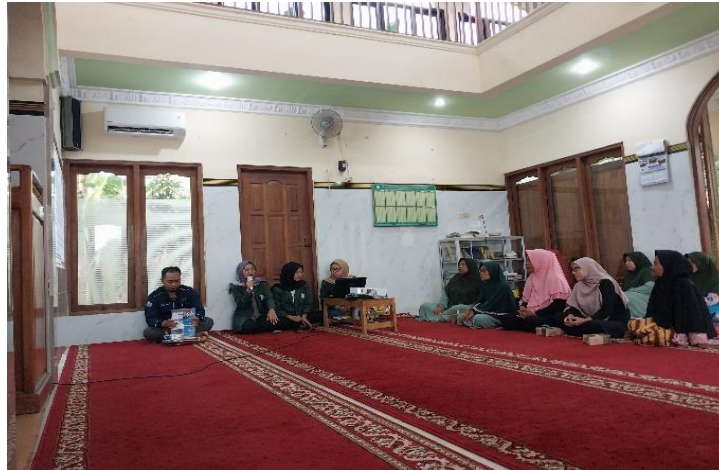
Gambar 4 Pemaparan Materi