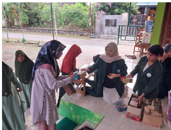
Gambar 2 Pengarahan Peserta