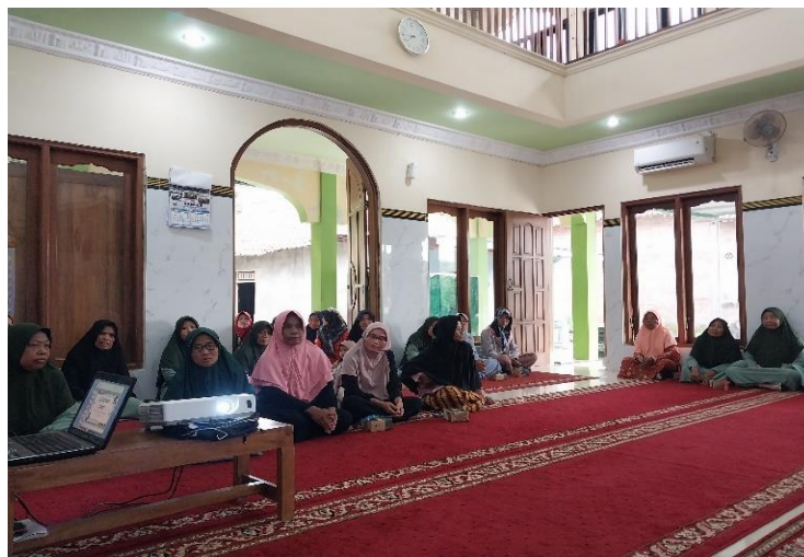
Gambar 5 Pemaparan Materi