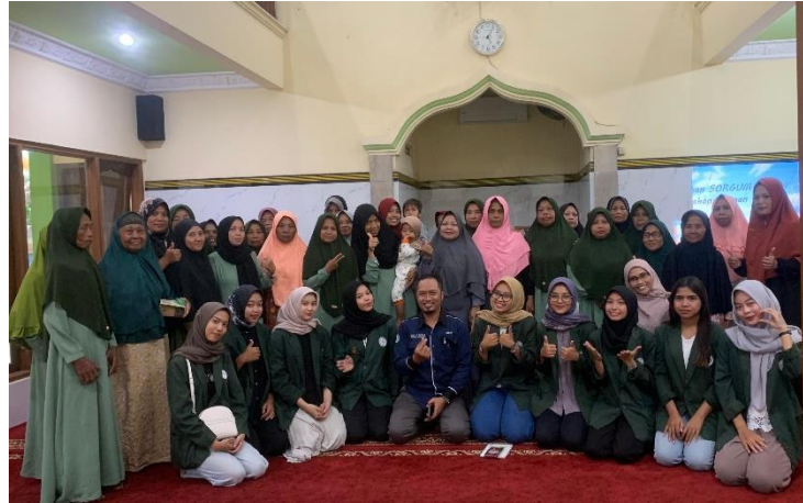
Gambar 7 Foto Bersama Dengan Warga Desa Ngiser

memberi pertanyaan kepada peserta sehingga ada timbal balik dalam komunikasi antar pemateri dan peserta[9]. Selain itu juga peserta mendapat hadiah jika berhasil menjawab pertanyaan. Peserta penyuluhan tidak ada kesulitan, paham dengan materi yang dijelaskan dan aktif bertanya tentang obat. Acara terakhir adalah melakukan acara penutupan kepada peserta penyuluhan dan dilanjut dengan sesi foto bersama dengan peserta penyuluhan.