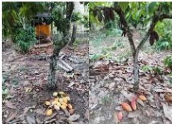
Gambar 1 Kulit kakao membusuk di sekitar perkebunan

Indonesia menempati posisi ketiga produksi kakao terbesar dunia dengan persentase mencapai 15,05%, setelah Pantai Gading dengan 38,78% dan Ghana dengan 18,17% [4]. Pada tahun 2022, produksi kakao di Provinsi Jawa Timur mencapai 33 ribu ton dan Kabupaten Jember menjadi salah satu penyumbang tertinggi yakni sebesar 2.957 ton [5]. Kabupaten Jember telah mengembangkan kakao menjadi salah satu komoditas utama sejak tahun 1967 dan pada tahun 2010, pemerintah setempat menginisiasi pengembangan penanaman kakao di beberapa kecamatan, termasuk Patrang [6]. Salah satu desa penghasil kakao di kecamatan tersebut adalah Desa Banjar Sengon. Saat musim panen, di desa tersebut hanya berfokus pada pengolahan biji kakao sedangkan limbah kulit buah kakao hanya dibiarkan begitu saja menumpuk di sekitar area perkebunan sebagaimana pada Gambar 1, sehingga nilai ekonomi dari pemanfaatan kulit buah kakao rendah. Padahal berat kulit buah kakao mencapai 75% seluruh berat buah. Kulit buah kakao sebagai bahan sisa dapat mencapai \pm 200.000 ton/tahun [7].