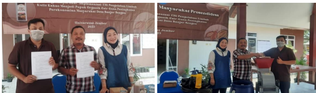
Gambar 9 Serah terima TTG

Pada tanggal 14 Oktober 2023 dilaksanakan sosialisasi kedua dan penyerahan TTG mesin pencacah kulit buah kakao dan komposter serta praktik penggunaan TTG dengan kader PKK. Materi yang disampaikan berupa pengenalan alat pencacah kulit buah kakao dan komposter berkenaan dengan cara penggunaan serta perawatan alat. Sosialisasi ini bertujuan untuk melakukan transfer keilmuan kepada kader PKK sebagai pelaksana lanjutan setelah kegiatan pengabdian selesai. Penyerahan alat dilakukan dengan penandatanganan surat serah terima alat TTG yang ditandatangani oleh ketua tim pengabdian dan Kepala Desa Banjar Sengon (Gambar 9).