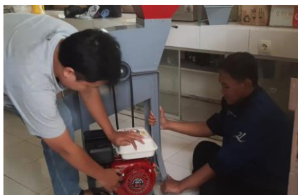
Gambar 4 Uji coba mesin pencacah

Berdasarkan permasalahan yang teridentifikasi, tim pengabdian melakukan diskusi terkait produk yang akan dihasilkan dan TTG yang akan digunakan. Pemilihan produk pupuk organik didasari pada ketergantungan masyarakat setempat terhadap penggunaan pupuk kimia, selain itu POC tergolong produk yang proses produksinya mudah. Setelah melakukan studi literatur untuk melakukan perencanaan proses pembuatan POC dan pengadaan TTG yang akan digunakan. Selanjutnya, pada tanggal 27 Mei 2023, tim pengabdian melakukan uji coba proses pembuatan POC dengan menggunakan TTG (mesin pencacah kulit buah kakao dan komposter). Tujuan uji coba ini adalah untuk menguji rencana proses dan alat sehingga dapat digunakan secara maksimal oleh mitra. Serangkaian kegiatan uji coba proses pembuatan POC dengan menggunakan TTG dapat dilihat pada Gambar 4 dan 5.