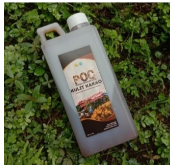
Gambar 6 Hasil produk pupuk organik cair

POC dengan menggunakan TTG juga ditunjukkan kepada mitra sebagai gambaran produk yang akan diproduksi (Gambar 6).