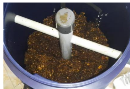
Gambar 5 Uji coba komposter

Hasil uji coba menunjukkan bahwa dengan adanya mesin pencacah dapat menghemat waktu dan tenaga dalam menghaluskan kulit buah kakao. Karakteristik kulit buah kakao yang kasar, tebal, dan keras membuatnya sulit untuk dihancurkan secara manual menggunakan pisau [17]. Penggunaan komposter dalam proses fermentasi juga sangat membantu karena komposter dapat secara otomatis dapat memisahkan antara bubur kulit buah kakao dengan air lindi hasil fermentasi yang disebut juga Pupuk Organik Cair (POC). Harapannya dengan adanya TTG ini mitra dapat memproduksi POC dengan efisien sehingga meningkatkan produktivitas pertanian dan berdampak pada peningkatan perekonomian mitra.