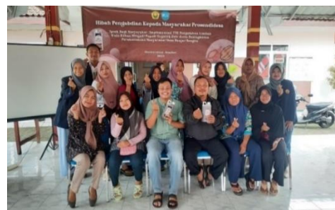
Gambar 8 Mitra sebagai peserta sosialisasi

Pada tanggal 14 Oktober 2023 dilaksanakan sosialisasi kedua dan penyerahan TTG mesin pencacah kulit buah kakao dan komposter serta praktik penggunaan TTG dengan kader PKK. Materi yang disampaikan berupa pengenalan alat pencacah kulit buah kakao dan komposter berkenaan dengan cara penggunaan serta perawatan alat. Sosialisasi ini bertujuan untuk melakukan transfer keilmuan kepada kader PKK sebagai pelaksana lanjutan setelah kegiatan pengabdian selesai. Penyerahan alat dilakukan dengan penandatanganan surat serah terima alat TTG yang ditandatangani oleh ketua tim pengabdian dan Kepala Desa Banjar Sengon (Gambar 9).