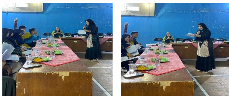
Gambar 2 Sesi Penyuluhan dan Diskusi