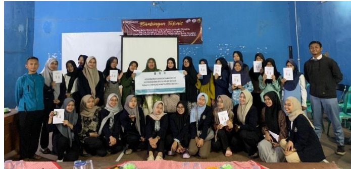
Gambar 3 Sesi foto Bersama peserta dan tim pengabdian kepada masyarakat

Selama proses edukasi tentang persiapan menarche berlangsung, peserta terlihat semangat dan penasaran dengan tema yang disampaikan. Dilanjutkan dengan sesi tanya jawab, para remaja secara bergantian mengajukan pertanyaan mengenai persiapan menstruasi pertama diantaranya apa saja yang harus dilakukan Ketika datangnya menstruasi, cara mengganti pembalut, berapa kali sehari ganti pembalut, jenis pembalut. Hasil evaluasi setelah dilakukan edukasi menunjukkan bahwa Sebagian besar remaja merasa edukasi ini sangat penting untuk persiapan menstruasi pertama. Beberapa remaja menyampaikan bahwa edukasi persiapan menstruasi pertama ini sangat penting dilaksanakan, berhubung para remaja yang sedang berada dalam kondisi periode antara kanak-kanak ke periode remaja yang memerlukan banyak bimbingan dan informasi khususnya mengenai reproduksi terutama menstruasi pertama yang merupakan salah satu dari ciri seorang remaja telah mengalami pubertas. Pengabdian juga memberikan booklet persiapan menarche yang dapat remaja baca Kembali di rumah dan dimanapun. Para remaja berharap akan ada edukasi-edukasi selanjutnya secara rutin mengenai tema-tema lain seputar menstruasi dan Kesehatan reproduksi remaja.