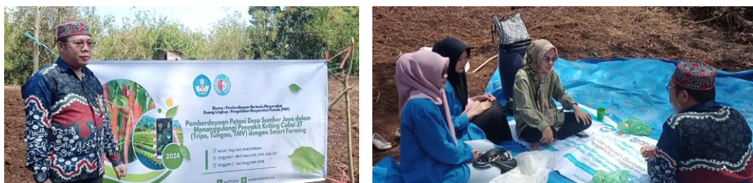
Gambar 7 Pendampingan dan implementasi teknologi

Tahap ini merupakan implementasi langsung dari teknologi yang telah dirancang, dengan pendampingan intensif dari tim pengusul. Pendampingan pembuatan pupuk organik dilakukan untuk memastikan bahwa teknologi ini dapat diterapkan dengan benar dan memberikan manfaat nyata bagi petani. Hasilnya, petani mampu mengurangi biaya produksi sekaligus meningkatkan kualitas tanah dan hasil panen. Pendampingan penggunaan mesin pengolah lahan dan aplikasi Smart Farming juga berjalan dengan baik. Tim pengusul memberikan bimbingan teknis tentang cara pengoperasian mesin dan aplikasi, sehingga petani dapat menggunakan teknologi ini secara optimal. Penggunaan aplikasi Smart Farming telah memudahkan petani dalam memonitor lahan secara real-time , mengelola input produksi, serta merencanakan kegiatan tani dengan lebih terstruktur.