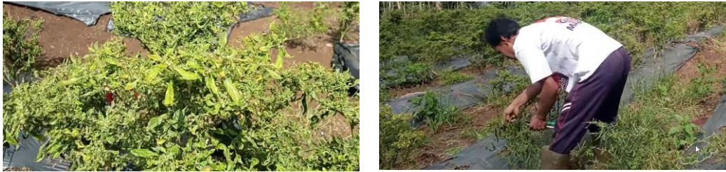
Gambar 2 Kondisi tanaman cabai mengalami penyakit 3T

artikel ilmiah memberikan dasar teoritis yang kuat bagi pengembangan teknologi yang akan diimplementasikan.