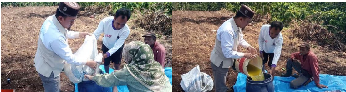
Gambar 3 Proses pembuatan pupuk organik

Pada tahap perancangan, teknologi yang direkomendasikan sebagai solusi untuk permasalahan Kelompok Tani Desa Sumber Jaya dirancang secara detail. Salah satu inovasi yang dirancang adalah pembuatan pupuk organik, yang bertujuan untuk mengurangi ketergantungan pada pupuk kimia dan menekan biaya produksi. Dengan pembuatan pupuk organik, diharapkan kesuburan tanah dapat ditingkatkan secara alami, yang pada gilirannya akan meningkatkan hasil panen cabai.