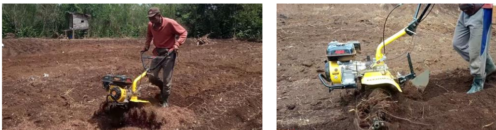
Gambar 4 Proses pengolahan lahan menggunakan mesin cultivator

Selain itu, dirancang juga teknologi pengolahan lahan menggunakan mesin cultivator yang dimodifikasi sesuai dengan kebutuhan tanaman cabai. Penggunaan mesin ini diharapkan dapat meningkatkan efisiensi pengolahan lahan, sehingga proses tanam dapat dilakukan lebih cepat dan dengan kualitas pengolahan yang lebih baik.