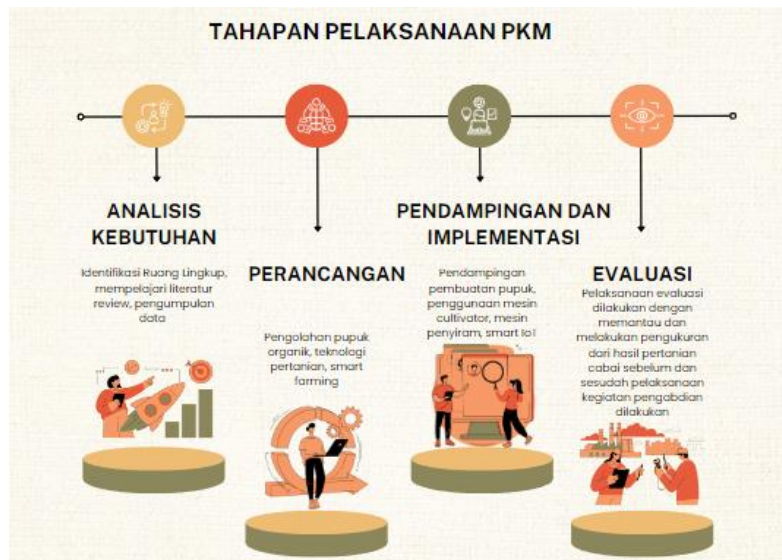
Gambar 1 Tahapan pelaksanaan PkM