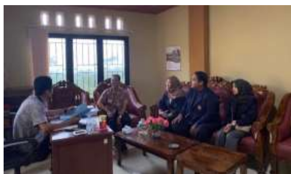
Gambar 3. Koordinasi dengan kepala desa Kembangkuning

Kegiatan PPMT Periode X tahun 2024, diawali dengan kegiatan koordinasi bersama kepala desa yang dilakukan di balai desa Kembangkuning, Kecamatan Windusari, Kabupaten Magelang. Kegiatan ini dilaksanakan pada 28 November 2024. Tujuan kegiatan ini adalah untuk menentukan prioritas dalam program kegiatan, terutama faktor-faktor yang mungkin menyebabkan tingginya angka stunting di desa ini serta langkah-langkah yang dapat diambil untuk menangani stunting di Kembangkuning seperti yang terlihat pada Gambar 3.