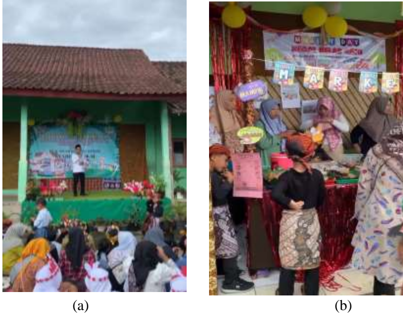
Gambar 7. (a) Sambutan Kepala Sekolah (b) Stand makanan sehat Market Day Festival

Market Day Festival tersebut dibuka untuk umum dan dikunjungi oleh warga sekitarnya seperti Gambar 7 (a), (b).