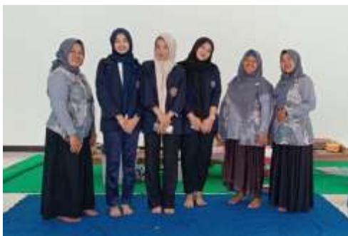
Gambar 5. Kegiatan Posyandu

Kegiatan yang dilaksanakan ini dalam rangka mendukung program nasional percepatan penurunan angka stunting, mahasiswa yang tergabung dalam kegiatan Program Pengabdian Masyarakat Terpadu (PPMT) Universitas Muhammadiyah Magelang (Unimma) yang ditempatkan di Desa Kembangkuning 4, Kecamatan Windusari, Kabupaten Magelang, telah memulai serangkaian kegiatan yang berfokus pada kesehatan masyarakat, khususnya gizi ibu dan anak seperti Gambar 5 dan 6.