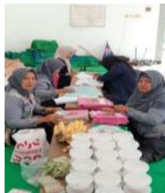
Gambar 6. Pembagian makanan bergizi kepada balita