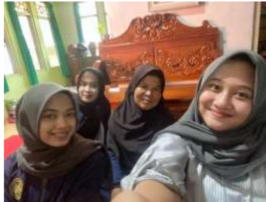
Gambar 4. Survei mitra PKK