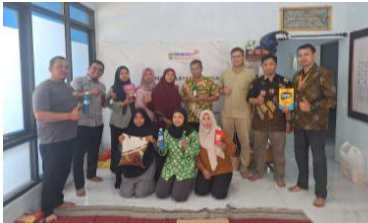
Gambar 2. Foto bersama peserta

Kegiatan pelatihan desain poster promosi untuk UMKM binaan Dinsospermasdes Kabupaten Jepara dilaksanakan pada tanggal 12 September 2024 bertempat di Rumah Pelayanan Sosial “Jepara Care” Dinsospermasdes Kabupaten Jepara. Kegiatan tersebut dihadiri oleh delapan peserta yang merupakan pelaku usaha UMKM binaan Dinsospermasdes. Foto narasumber bersama peserta ditunjukkan pada gambar 2.