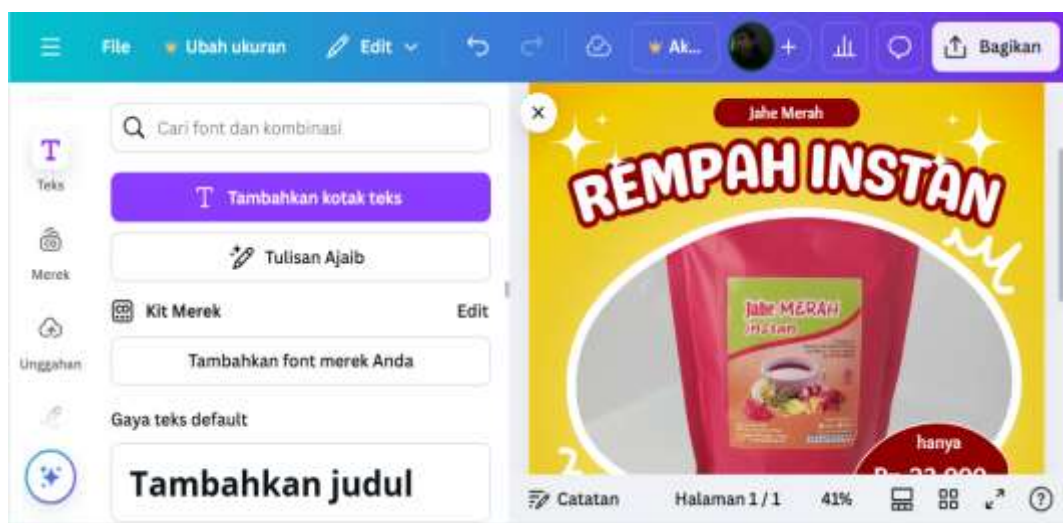
Gambar 6. Tampilan aplikasi canva

Praktik desain poster promosi dilakukan dengan menggunakan perangkat smartphone . Smartphone dipilih karena setiap peserta sudah memiliki dan terbiasa menggunakan smartphone untuk aktivitas sehari-hari. Dengan demikian, maka para peserta hanya perlu belajar aplikasi saja tanpa perlu belajar perangkat dan environment sistem operasi yang digunakan. Aplikasi yang digunakan pada pelatihan ini adalah aplikasi Canva. Canva dapat memenuhi kebutuhan desain info grafis yang kreatif [2]. Canva menyediakan banyak fitur seperti image, bentuk, font, dan sebagainya, serta penggunaannya mudah hanya dengan drag and drop [11]. Selain itu, canva menyediakan ribuan tema yang dapat digunakan sebagai template untuk membuat desain poster. Dengan demikian, maka para peserta dapat memilih tema yang kreatif sehingga mempercepat proses desain. Gambar 6 menunjukkan penggunaan aplikasi canva dengan membuat poster berdasarkan tema yang telah disediakan.