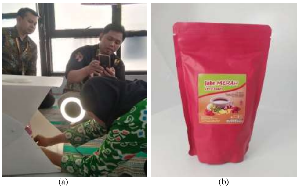
Gambar 5. Praktik Pengambilan Foto Produk (a) pengambilan foto produk (b) hasil foto produk

Sesi pelatihan selanjutnya adalah praktik pengambilan foto produk sebagai bahan untuk poster yang akan dibuat. Praktik pengambilan foto dilakukan dengan menggunakan kamera smartphone karena praktis dan dimiliki oleh semua peserta. Untuk menunjang kualitas foto dan menjawab masalah pencahayaan yang dilakukan dalam ruangan, maka digunakan alat bernama mini studio dengan pencahayaan bersumber dari ring light . Dengan menggunakan alat-alat sederhana tersebut, maka peserta tidak membutuhkan kemampuan fotografi tinggi untuk dapat menghasilkan foto produk berkualitas. Praktik pengambilan foto produk serta hasil dari foto produk yang diperoleh dari praktik ini ditunjukkan pada gambar 5.