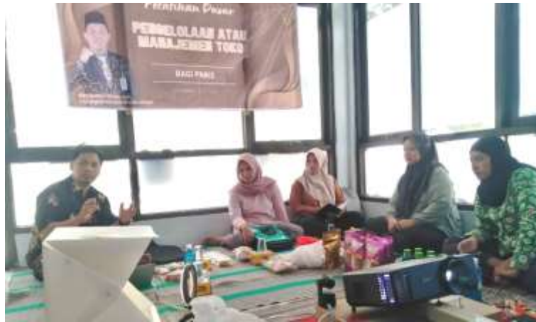
Gambar 4. Sesi Pemaparan Teori Desain Poster

Pada akhir sesi pemaparan teori ini, diadakan sesi diskusi untuk mengevaluasi poster promosi yang sudah pernah dibuat oleh masing-masing peserta. Sebagian peserta telah membuat promosi melalui berbagai media, namun desain poster dan infografis yang dibuat masih belum optimal. Sebagian peserta lainnya, belum pernah mempromosikan produknya melalui media. Suasana pemaparan materi dan diskusi antara narasumber dan peserta ditunjukkan pada gambar 4.