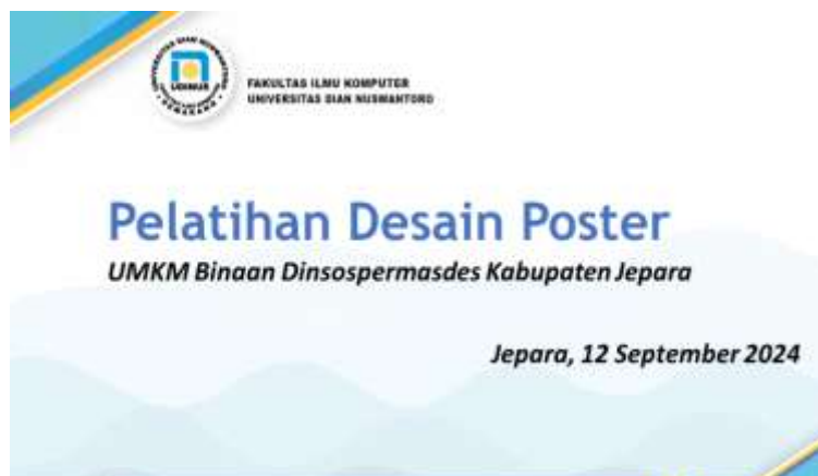
Gambar 3. Slide Teori Desain Poster

Teori desain poster disampaikan secara lisan dengan bantuan ilustrasi melalui slide power point. Peserta mampu memahami materi yang disampaikan dengan baik. Ilustrasi dan contoh-contoh yang relevan ditunjukkan melalui slide pada gambar 3.