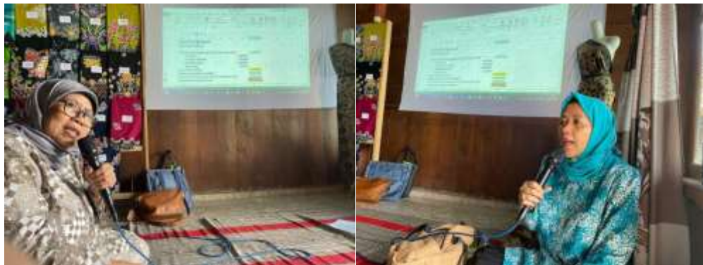
Gambar 8. Penyampaian Materi Kegiatan Pengabdian Masyarakat

Kesulitan yang ditemui oleh tim dalam pelaksanaan kegiatan pelatihan ini adalah sebagai berikut: