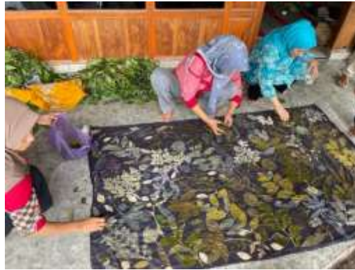
Gambar 5. Bentuk Diversifikasi Produk Batik