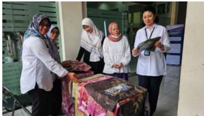
Gambar 3. Produk Batik Kartika Dipajang dalam Rangka Meraih Peluang Pasar

Batik Kartika menjalankan aktivitas dalam produksi batik tulis dan cap. Secara sederhana Batik Kartika sudah mampu menjalankan operasional dalam produksi dan pemasaran produk batik. Permasalahan pertama, berkaitan manajemen usaha khususnya dalam pencatatan keuangan dan stok barang dinilai penting untuk dilakukan pendampingan. Permasalahan kedua, berkaitan daya saing produk yang memerlukan pengembangan inovasi variasi batik yang ditawarkan kepada pembeli. Diversifikasi produk penting dilakukan untuk menjangkau peluang pasar dan mengembangkan usaha [2].