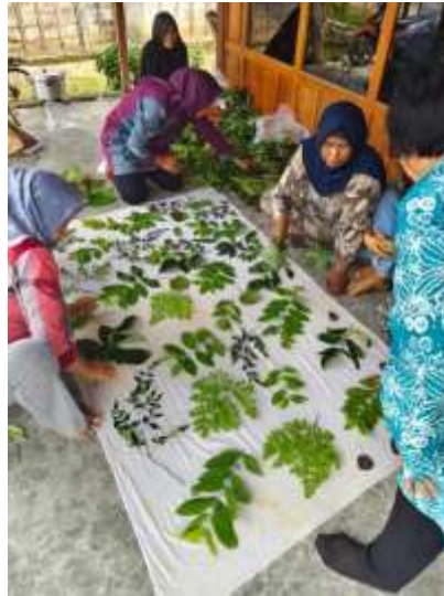
Gambar 7. Penggunaan Bahan Baku Lokal