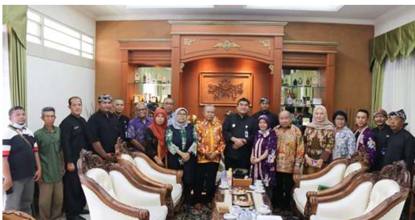
Gambar 1. Audiensi bersama Bupati Blora, dihadiri oleh DINDAGKOPUKM, BAPPEDA, dan masyarakat penerima manfaat

Pemberdayaan terhadap UMKM bukan hanya sekedar program ekonomi, melainkan untuk menjamin keberlanjutan yang lebih stabil, adil, dan sejahtera bagi seluruh masyarakat. Salah satu fokusnya adalah dengan meningkatkan literasi dalam pengelolaan keuangan UMKM. Meningkatkan pengetahuan pengelolaan keuangan bagi UMKM sangat penting karena merupakan kunci utama dalam mencapai keberlanjutan dan pertumbuhan bisnis yang stabil tersebut. Komunikasi pemberdayaan masyarakat telah dilakukan oleh tim dengan dilakukannya audiensi bersama Bupati Kabupaten Blora. Permasalahan pengurangan angka kemiskinan, peningkatan produk kreatif dan UKM naik kelas, serta upaya menciptakan produk unggulan di Kabupaten Blora. Sesuai dengan program kegiatan, pihak Pemerintah Kabupaten Blora menindak lanjuti dengan dilaksanakannya penandatanganan PKS (Perjanjian Kerja Sama) antara tim dari UNS dengan DINDAGKOPUKM Kabupaten Blora.