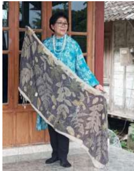
Gambar 6. Hasil Produk yang Mempunyai Daya Saing di Pasar