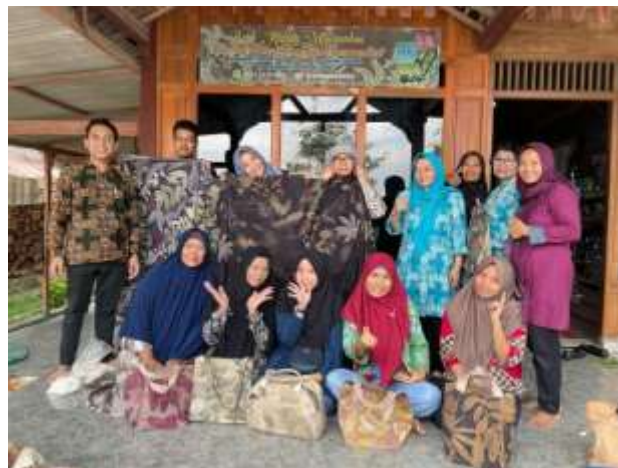
Gambar 4. Peserta Kegiatan Pengabdian Kepada Masyarakat