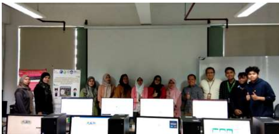
Gambar 6 Dokumentasi Pelatihan Penggunaan Pengelolaan Data Google Drive PAUD Khairani