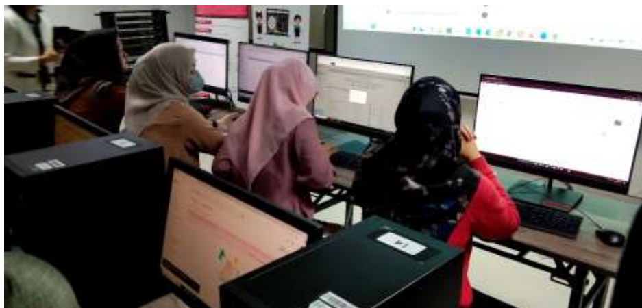
Gambar 5 Pelatihan Pengelolaan Data Google Drive PAUD Khairani

Evaluasi pelatihan dilakukan dengan observasi langsung dan kuesioner. Hasil evaluasi menunjukkan adanya peningkatan dalam pemahaman dan kemampuan terkait penggunaan Google Drive. Pada awal pelatihan, sebagian besar peserta tampak kurang terampil ketika menggunakan fitur Google Drive. Namun, setelah mengikuti pelatihan, peserta menunjukkan antusiasme dan kemampuan yang meningkat dalam berkolaborasi dan mengelola data secara digital. Beberapa peserta masih membutuhkan pendampingan lebih lanjut untuk kebutuhan spesifik.