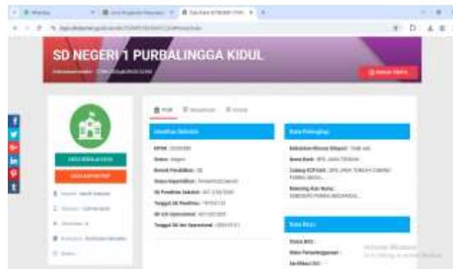
Gambar 1. Data SDN 1 Purbalingga Kidul di DAPODIK

Metode pengabdian masyarakat digambarkan dengan diagram alir pada gambar 1.