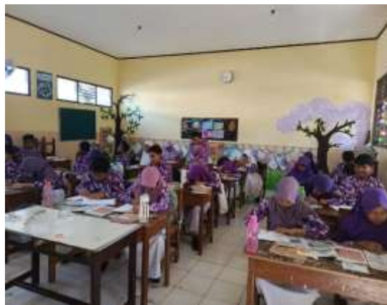
Gambar 7. Pelaksanaan Post-test

Gambar 6 menunjukkan bahwa kegiatan dilanjutkan dengan siswa berlatih untuk membuat kalimat comparative dan superlative . Setiap siswa membuat kalimat perbandingan ( comparative sentence ) yakni membandingkan animal flashcard yang dimilikinya dengan animal flashcard yang dimiliki oleh teman sebangkunya (berpasang-pasangan).