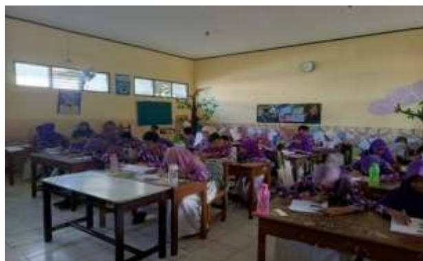
Gambar 3. Pelaksanaan Pre-test

Kegiatan PKM penggunaan media flashcard dalam pembelajaran kosakata bahasa Inggris merupakan salah satu bentuk kegiatan yang bertujuan untuk meningkatkan motivasi belajar dan pemahaman terhadap kosakata bahasa Inggris. Kegiatan ini dilaksanakan pada tanggal 6 Maret 2025 di SDN 1 Purbalingga Kidul. Sekolah tersebut beralamat di Jl. Wiramenggala, Purbalingga Kidul, Kec. Purbalingga, Kabupaten Purbalingga, Jawa Tengah 53314. Peserta yang mengikuti kegiatan PKM ini sebanyak 29 siswa.