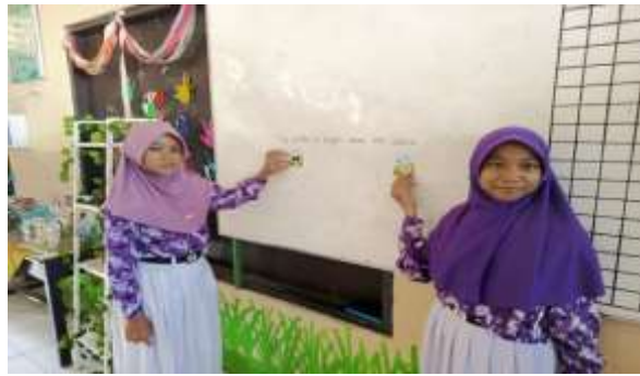
Gambar 6. Siswa membuat comparative sentence dan superlative sentence dengan menggunakan animal flashcard

Gambar 6 menunjukkan bahwa kegiatan dilanjutkan dengan siswa berlatih untuk membuat kalimat comparative dan superlative . Setiap siswa membuat kalimat perbandingan ( comparative sentence ) yakni membandingkan animal flashcard yang dimilikinya dengan animal flashcard yang dimiliki oleh teman sebangkunya (berpasang-pasangan).