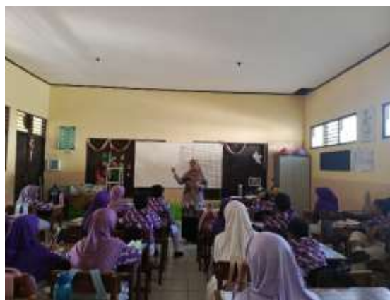
Gambar 5. Tim PKM mengimplementasikan guessing games dengan media flashcard

Gambar 4 menunjukkan antusiasme siswa dalam proses pembelajaran kosa kata bahasa Inggris dengan menggunakan flashcard. Siswa mempelajari comparative adjectives dan superlative adjectives untuk mendeskripsikan animals . Tim PKM menyiapkan adjectives dan animal flashcard .