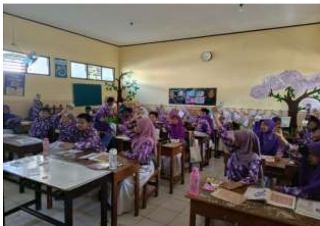
Gambar 4. Siswa mempelajari animals dan adjectives flashcard

Gambar 4 menunjukkan antusiasme siswa dalam proses pembelajaran kosa kata bahasa Inggris dengan menggunakan flashcard. Siswa mempelajari comparative adjectives dan superlative adjectives untuk mendeskripsikan animals . Tim PKM menyiapkan adjectives dan animal flashcard .