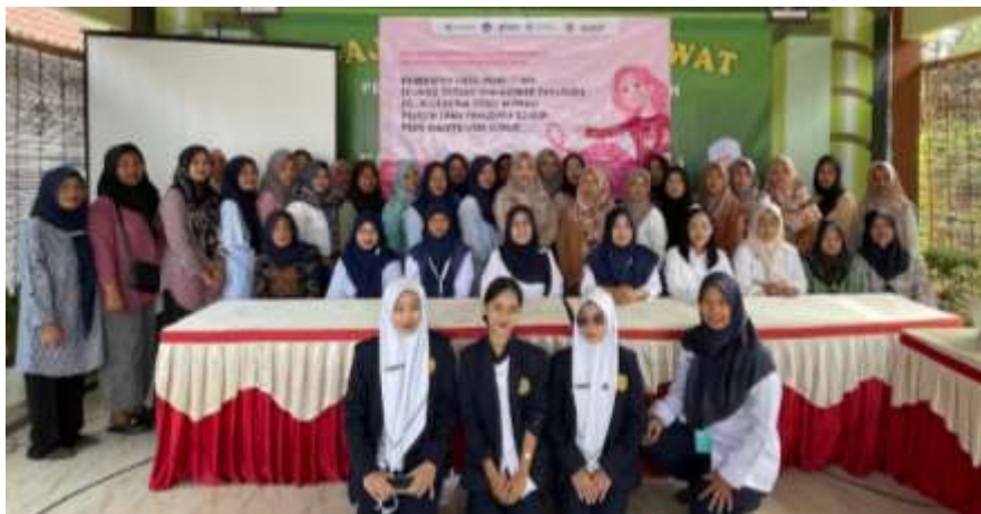
Gambar 4. Peserta pengabdian kepada masyarakat Desa Karangtengah

Setelah kegiatan pengabdian masyarakat selesai sebagai dokumentasi kegiatan selanjutnya dilakukan foto bersama, pada gambar 4 berikut ini