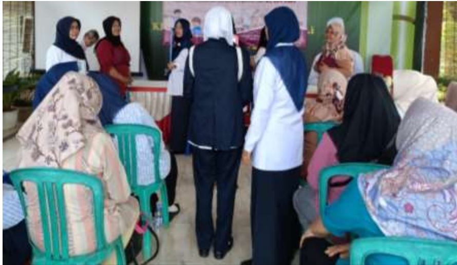
Gambar 3. Pendampingan praktik SADARI

Setelah kegiatan pengabdian masyarakat selesai sebagai dokumentasi kegiatan selanjutnya dilakukan foto bersama, pada gambar 4 berikut ini