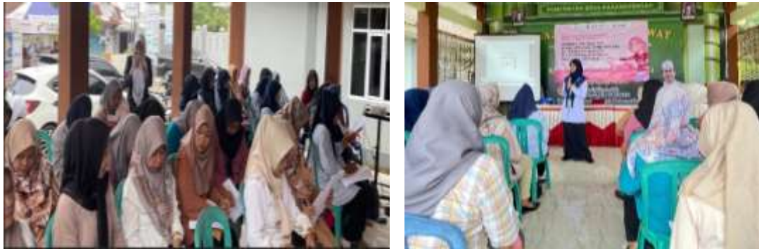
Gambar 2. Peserta pre test dan penyampaian materi SADARI

Media yang digunakan dalam pengabdian kepada masyarakat ini video animasi Pemeriksaan Payudara Sendiri (SADARI). Media lain yang menunjang demonstrasi/praktik SADARI menggunakan dilengkapi phantoom payudara (benda tiruan payudara) dan cermin. Pemanfaatan media video animasi dapat meningkatkan keterampilan pemeriksaan payudara sendiri. Video animasi yang digunakan dalam pengabdian kepada masyarakat ini telah memperoleh Sertifikat Hak Cipta No: EC00202367349 Tanggal 15 Agustus 2023. Kegiatan pengabdian kepada masyarakat diawali memberikan ceramah, peserta mendengarkan dan memperhatikan video animasi Pemeriksaan Payudara Sendiri. Kegiatan pengabdian kepada masyarakat ini dengan pre test, ceramah dan pemutaran video animasi tentang SADARI, demostrasi dan post test dapat dilihat pada gambar 2 berikut: