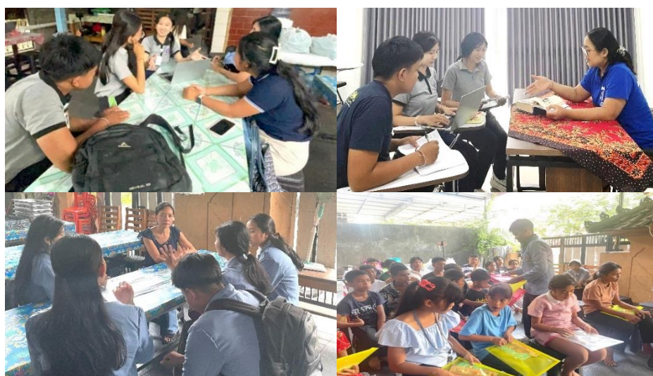
Gambar 1. Dokumentasi Tahapan Persiapan

Prosedur pelaksanaan pengabdian terbagi menjadi tiga tahapan utama: Tahap Persiapan (Pra Kegiatan), Tahap Pelaksanaan Inti (Pelatihan dan Pendampingan), serta Tahap Monitoring dan Evaluasi. Tahap persiapan (Juli 2025) sangat krusial, meliputi penyusunan materi Konseling Percakapan Krishna dan Arjuna dan perancangan Buku Pedoman Mitra yang akan menjadi panduan bagi remaja panti. Koordinasi intensif dengan Dosen Pendamping untuk validasi strategi konseling dan pembuatan instrumen evaluasi, termasuk angket Checklist gejala stres yang mengadaptasi instrumen Child Behavior Checklist (CBCL) , pre-test dan post-test kognitif, serta lembar observasi keterampilan konselor sebaya. Tahap ini mencakup pengadaan media seperti video pengenalan epos Mahabharata dan tutorial pembuatan diorama. Dokumentasi kegiatan pada Gambar 1 serta rincian kegiatan tahap persiapan tercantum pada Tabel 1. Ditutup dengan sosialisasi program kepada seluruh mitra dan pelaksanaan pre-test awal sebagai data dasar pengukuran kognitif.