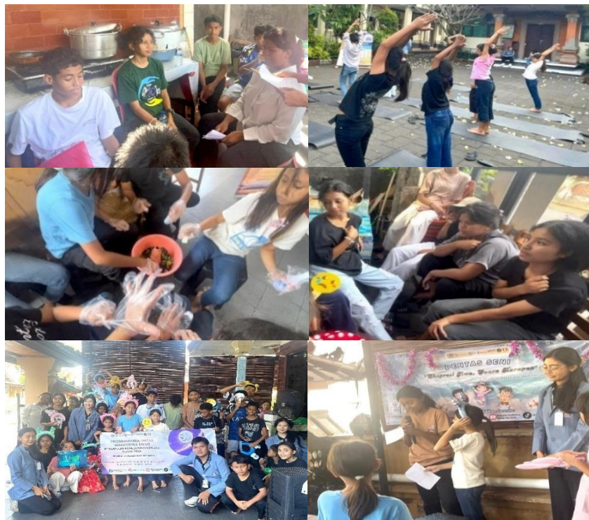
Gambar 5. Dokumentasi Tahapan Pendampingan

Tahap pendampingan dilakukan sebanyak 3 sesi (4 jam/sesi) pada September 2025, yang merupakan kunci keberlanjutan program. Dalam tahap ini, terjadi alih peran secara bertahap, sebanyak 20 remaja panti yang telah dilatih secara bergantian berperan sebagai Konselor Sebaya memimpin sesi konseling bagi 35 anak lainnya (dibagi dalam kelompok-kelompok kecil). Pendampingan ini memastikan keterampilan konseling teman sebaya yang dimiliki remaja menjadi terinternalisasi dan dapat diterapkan secara mandiri, meliputi praktik memimpin diskusi filosofis, yoga, hingga simulasi diorama. Dokumentasi kegiatan pada Gambar 5 serta rincian kegiatan pada tahap pendampingan ini disajikan pada Tabel 3.