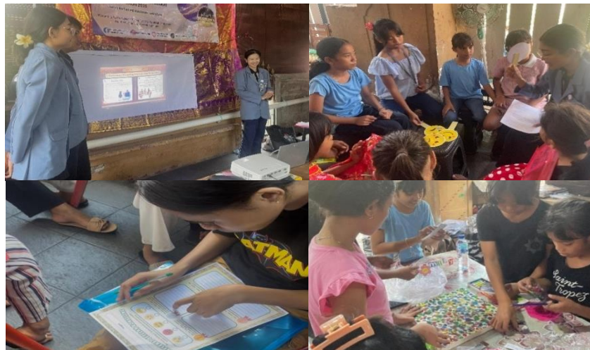
Gambar 2. Dokumentasi Tahapan Prajuna 1