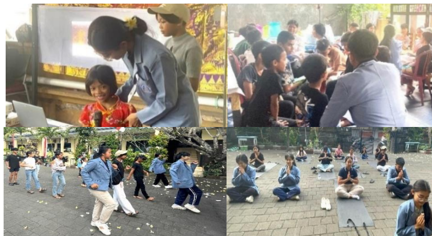
Gambar 3. Dokumentasi Tahapan Prajuna 2