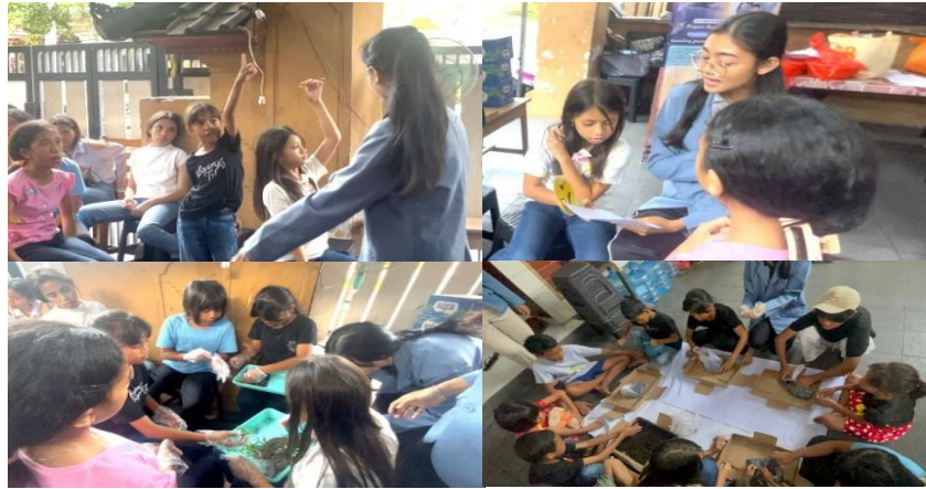
Gambar 4. Dokumentasi Tahapan Prajuna 3

Tahap pendampingan dilakukan sebanyak 3 sesi (4 jam/sesi) pada September 2025, yang merupakan kunci keberlanjutan program. Dalam tahap ini, terjadi alih peran secara bertahap, sebanyak 20 remaja panti yang telah dilatih secara bergantian berperan sebagai Konselor Sebaya memimpin sesi konseling bagi 35 anak lainnya (dibagi dalam kelompok-kelompok kecil). Pendampingan ini memastikan keterampilan konseling teman sebaya yang dimiliki remaja menjadi terinternalisasi dan dapat diterapkan secara mandiri, meliputi praktik memimpin diskusi filosofis, yoga, hingga simulasi diorama. Dokumentasi kegiatan pada Gambar 5 serta rincian kegiatan pada tahap pendampingan ini disajikan pada Tabel 3.