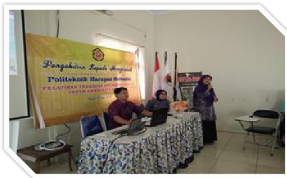
Gambar 1. Pemberian Materi Pajak bagi IKM