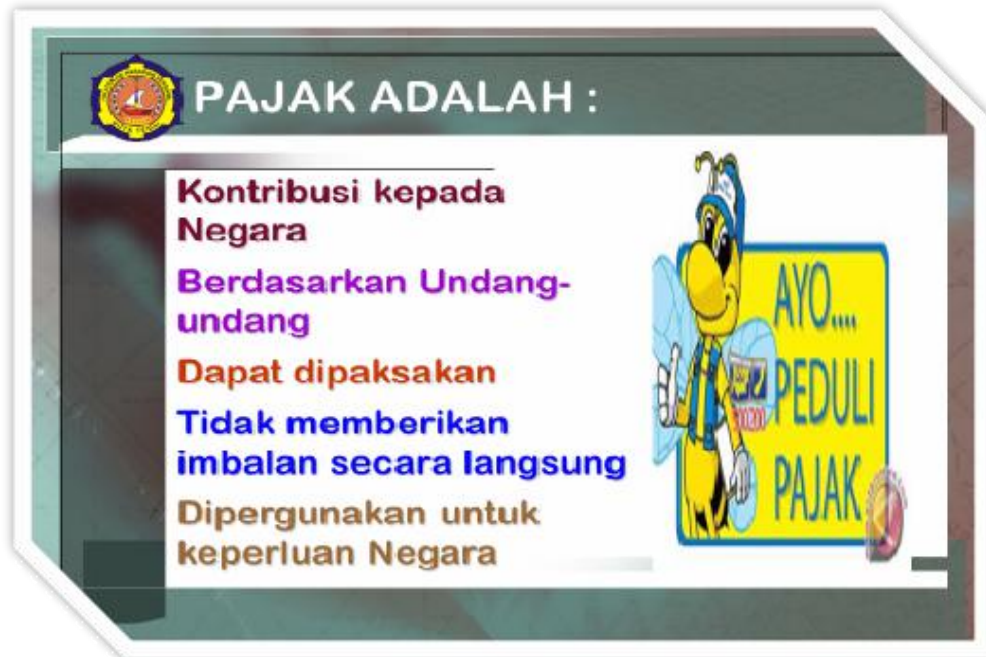
Gambar 2. Materi Pengenalan Pajak bagi IKM.