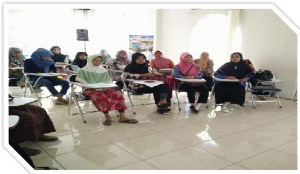
Gambar 6. Para Peserta mendengarkan materi yang diberikan oleh Nara Sumber.

Pada gambar 6 di atas memperlihatkan kegiatan pelatihan peningkatan pemahaman para pelaku Industri Kecil dan Menengah (IKM) tentang pentingnya pemahaman pajak bagi Industri Kecil dan Menengah (IKM) di Kota Tegal. Pada pemberian materi ini peserta menyimak tentang mengenai Pajak bagi Industri Kecil dan Menengah (IKM), PPh Orang Pribadi, Pengisian SPT Tahunan WP Orang Pribadi dan Cara melaporkan SPT PPh WP Orang Pribadi. Pada pelatihan ini juga disertai dengan tanya jawab dan diskusi dengan para peserta pelatihan.