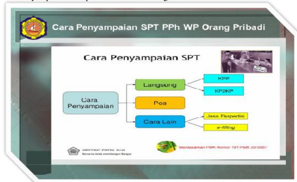
Gambar 5. Materi Cara Penyampaian SPT PPh WP Orang Pribadi