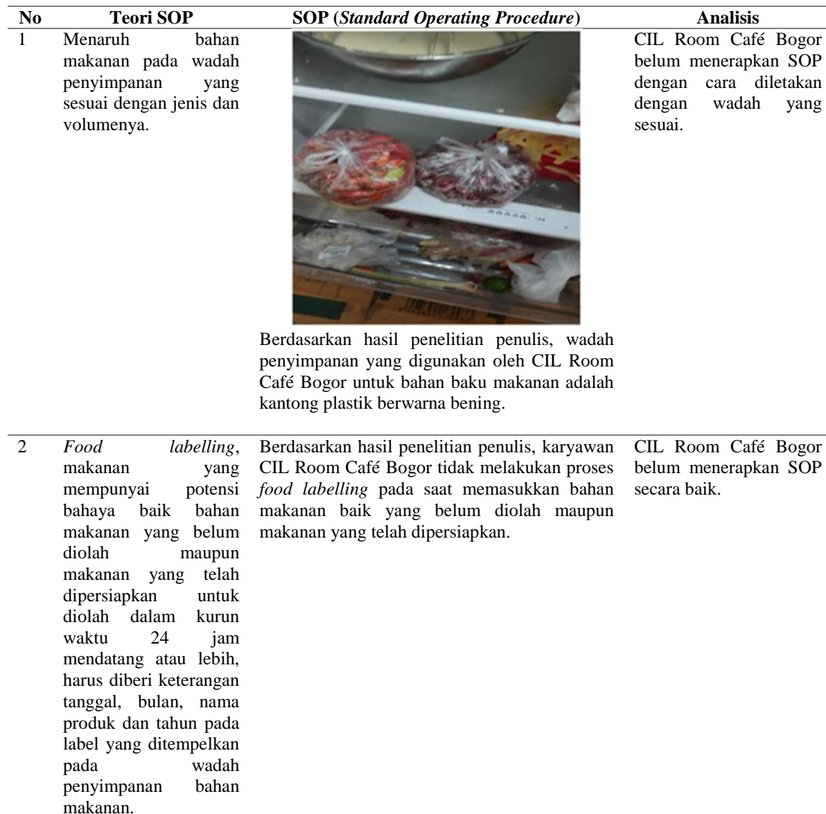
Tabel 2. Perbandingan hasil penelitian dengan teori SOP ( standard operating procedure ) tempat penyimpanan bahan makanan

dan sesuai dengan hasil yang diinginkan (bahan makanan yang disimpan dapat berkualitas).