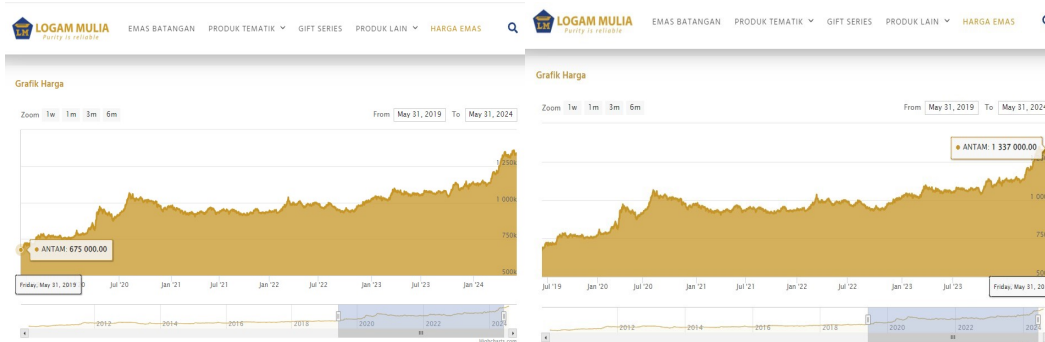
Gambar 1. Grafik Harga Emas 5 tahun terakhir 31 Mei (2019-2024)