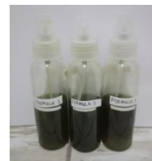
Gambar 2. Spray gel ekstrak daun pandan wangi

Uji organoleptis dilakukan dengan menggunakan penginderaan yakni meliputi warna, aroma dan konsistensi. Hasil pengujian organoleptis spray gel ekstrak daun pandan wangi dapat dilihat pada tabel 2 dan sediaan spray gel ekstrak daun pandan wangi dapat dilihat pada gambar 2.