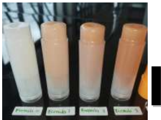
Gambar 1. Sediaan lip balm ekstrak kulit buah

Hasil pemeriksaan organoleptis terhadap lip balm ekstrak kulit buah melinjo meliputi bentuk, warna, dan bau selama penyimpanan 4 minggu. Diperoleh sediaan setengah padat, warna yang berbeda di setiap formula dimana F0 (tidak berwarna), F1 (jingga pucat), F2 (jingga muda), dan F3 (jingga), hasil dapat dilihat pada ( Gambar 1, Tabel 3 ). Perbedaan warna disebabkan konsentrasi yang berbeda pada setiap formula, semakin tinggi konsentrasi maka warna yang dihasilkan semakin pekat. Pada pembuatan sediaan lipstik ekstrak kulit melinjo yang dilakukan, dihasilkan sediaan warna oranye dari pigmen karotenoid ekstrak [17]. Kemudian masing-masing formula lipbalm ini memiliki bau orange yang dapat menutup aroma khas kulit melinjo. Dari hasil organoleptis sediaan lip balm selama 4 minggu, lip balm masih stabil dalam segi bentuk, warna dan baunya.