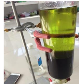
Gambar 1. Proses purifikasi ekstrak etanol daun sirih

senyawa aktif akibat pemanasan berlebih, sehingga diperoleh ekstrak kental yang lebih murni dan siap digunakan untuk tahap penelitian selanjutnya. Proses purifikasi dihentikan ketika ekstrak telah terpisah dengan n-heksan yang jernih seperti yang dilihat pada Gambar 1 .