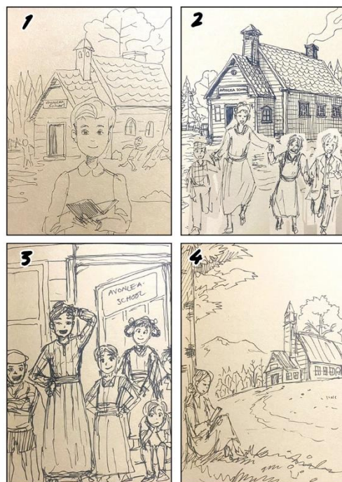
Fig 2. Thumbnail sketches

Ilustrasi Anne of Avonlea telah selesai dikerjakan sesuai dengan creative brief dan konsep yang telah ditentukan sebelumnya. Secara proses, pada tahap thumbnail sketches terdapat 4 alternatif sketsa dengan penomoran 1, 2, 3, dan 4 sebagai berikut: