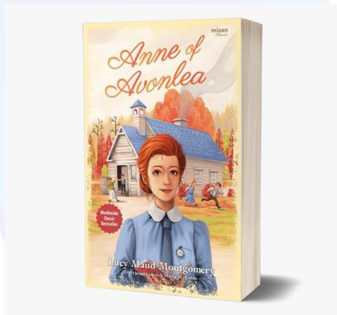
Fig 6. Implementasi ilustrasi dalam buku cetak

Tahap terakhir dalam keseluruhan proses perancangan ilustrasi ini adalah implementasi desain ke versi cetak. Untuk versi cetak, ilustrasi yang digunakan dalam ukuran 13,5 x 20,5 cm masing-masing untuk bagian depan dan belakang buku, dengan punggung buku setebal 2,2 cm. Untuk kelebihan ukuran pada proses cetak akan dipotong sehingga menghasilkan ukuran yang sesuai pada implementasi bukunya.