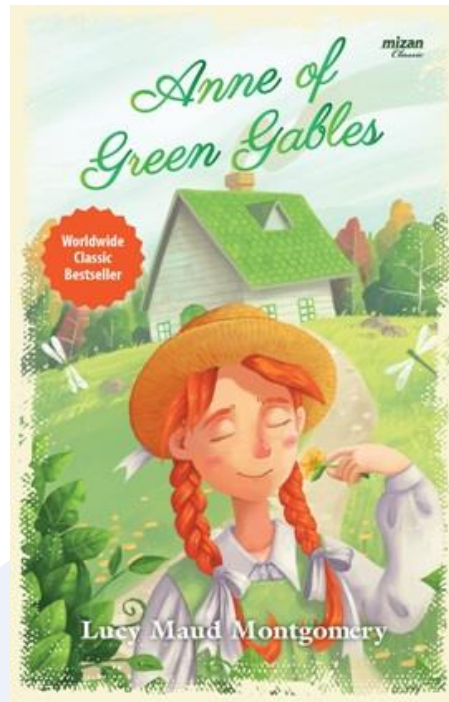
Fig 1. Ilustrasi Anne of Green Gables