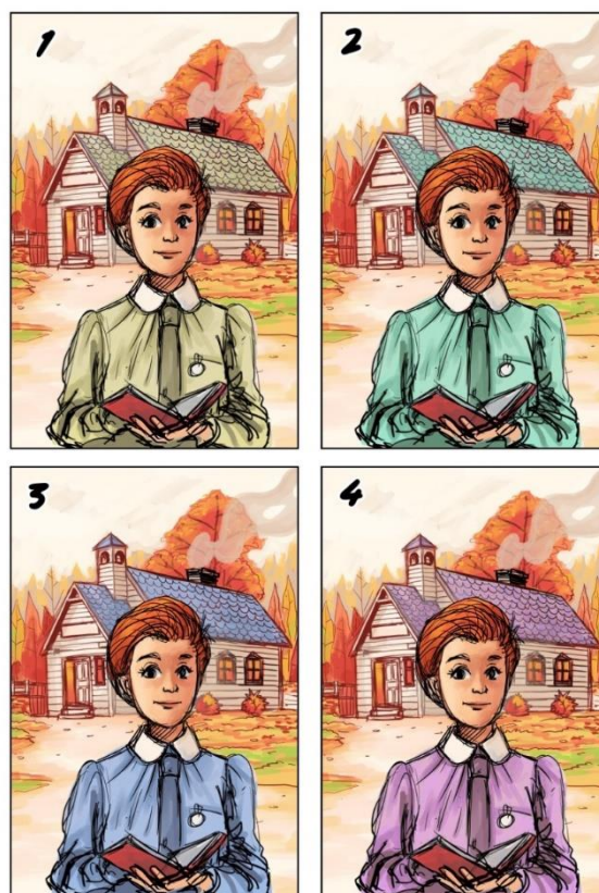
Fig 3. Roughs

Adapun pada tahap roughs dibuatkan empat alternatif warna yang akan dipilih satu untuk dilanjutkan ke tahap selanjutnya. Alternatif yang dihadirkan adalah sebagai berikut: