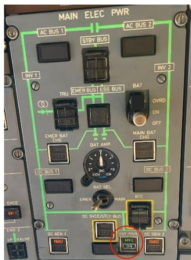
Gambar 2. Main Electrical Power

ATR merupakan pesawat penumpang bermesin twin-turboprop yang dikembangkan dan diproduksi oleh Avions de Transport Régional (ATR) dirancang untuk melayani penerbangan dengan rute jarak pendek hingga menengah. Sistem kelistrikan pada pesawat ATR terdiri dari tiga jenis yaitu direct current (DC) 28 V DC, alternating current (AC) 115 V AC / 400 Hz, dan alternating current dengan variable frequency (ACW) 115 V AC / 341-488 Hz [11]. Ketiga jenis sistem kelistrikan tersebut dialirkan ke seluruh bagian pesawat melalui busbar yang dikontrol oleh Bus Power Control Unit (BPCU) [12].