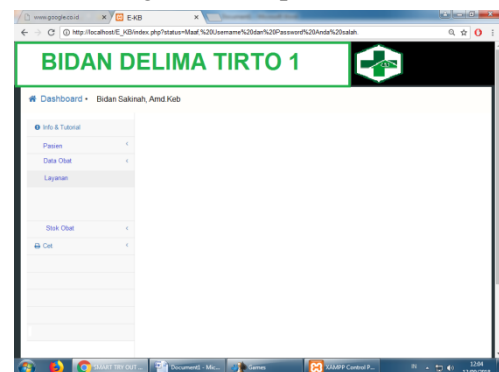
Gambar 2 Aplikasi E-KB