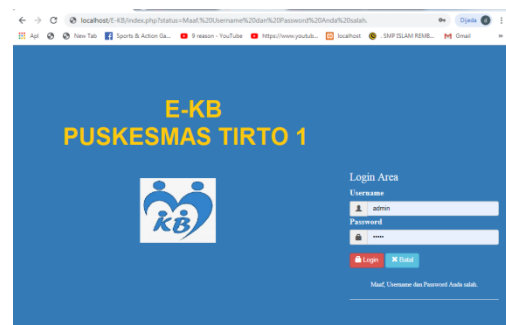
Gambar 1 Tampilan awal E-KB alur proses sistem yang terjadi didalam aplikasi E-KB.

E-KB menggunakan IoT dikembangkan menggunakan aplikasi PHP dan mysql yang menghubungkan secara offline. aplikasi ini memungkinkan di mempercepat kerja bidan praktek swasta. Berikut adalah tampilan awal E-KB menggunakan IoT yang sudah di buat.