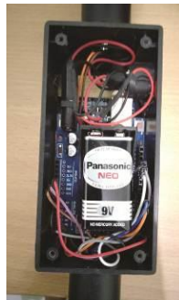
Gambar 4. Penampakan Instalasi Smart Blind Stick

Dalam proses pengujian fungsi alat, langkah-langkahnya adalah sebagai berikut: