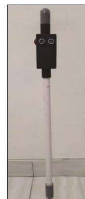
Gambar 3. Smart Blind Stick dengan Atmega 328

Total panjang dari Smart Blind Stick adalah 80cm, dengan box tempat untuk mikrokontroller 12cm dan lebar 6cm. Di dalam box tersebut terdapat beberapa komponen penyusun smart blind stick , penampakan komponen tersebut dapat dilihat pada Gambar 4.