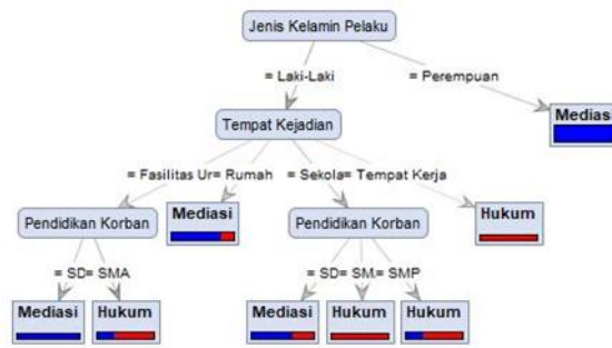
Gambar 2. Decision Tree